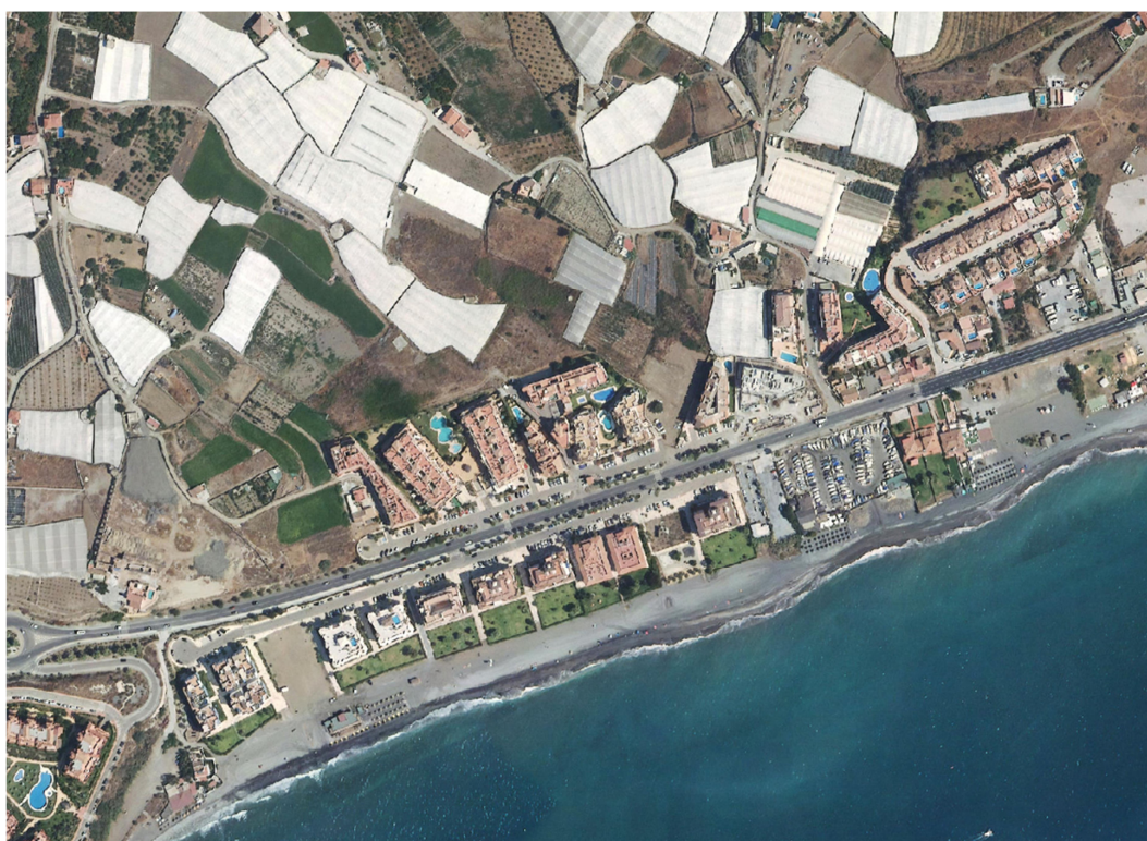
Playa del Peñoncillo