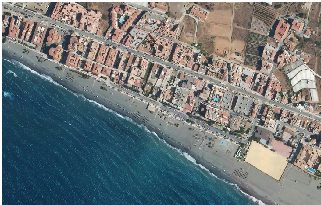
Playa del Cenicero

en los tramos occidentales de la zona de estudio: playas del Cenicero en la localidad de "El Morche" y en la playa del Peñoncillo.