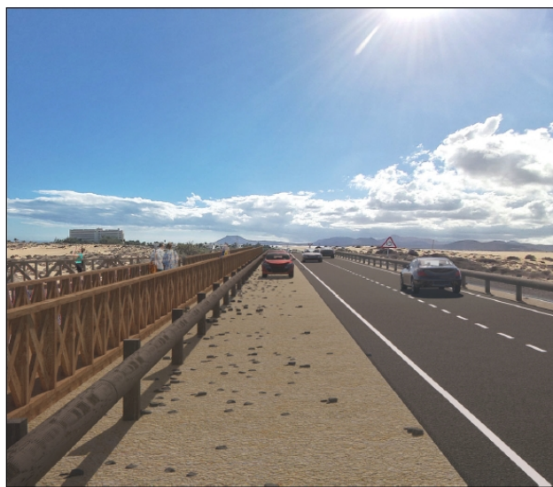
FOTOMONTAJE SENDERO NATURAL

Desde el Sendero Natural parten los dos accesos Peatonales hasta la Playa. Dichos accesos tienen 2 metros de paso libre y el mismo diseño que el Sendero Natural, con la única salvedad de que está instalada sobre pilotes de madera de 30 cm de diámetro que permitirá que fluya de manera Natural la Dinámica Litoral de la Zona.