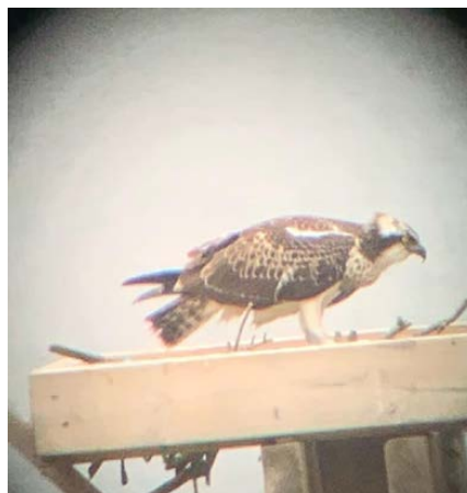
Foto 1. Detalle del nido de águila pescadora instalado en el año 2018 por voluntari@s de SEO/BirdLife en la marisma de Pombo y foto de un ejemplar posada en el mismo en agosto de 2019.