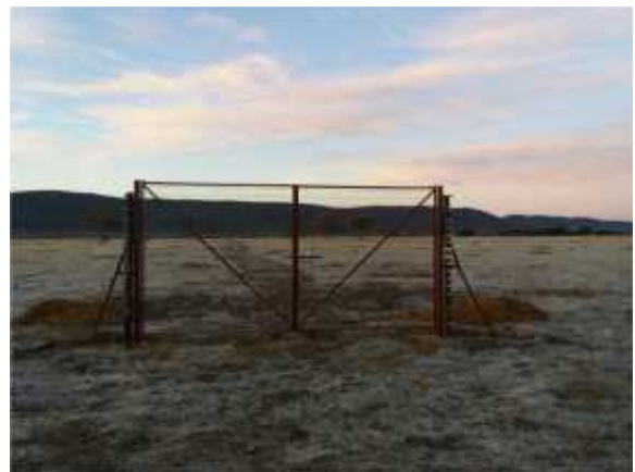
Postes colocados y puerta de cerramiento