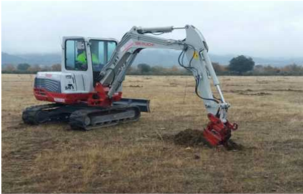
Apertura de hoyos para plantación