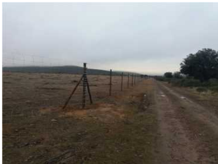
Tramo de cerramiento terminado