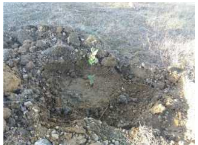
Personal plantando en hoyos abiertos previamente y planta en alcorque