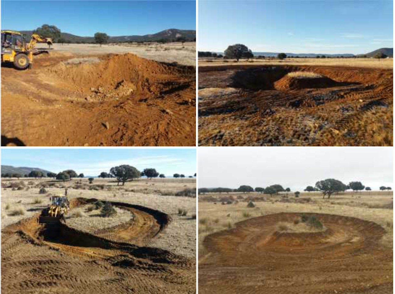
Trabajos de excavación de charcas