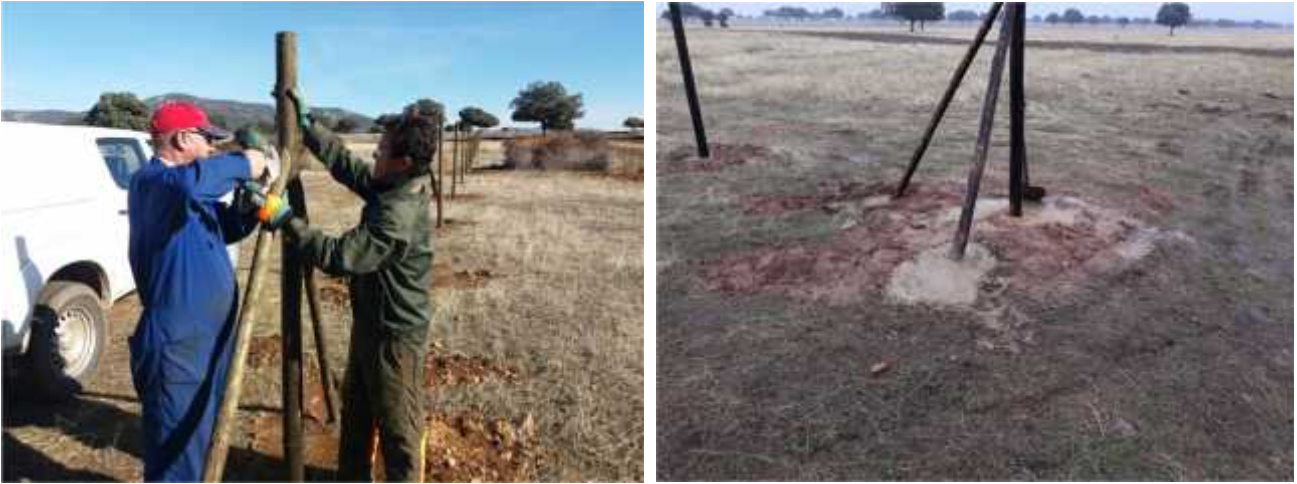
Trabajos de instalación del cerramiento