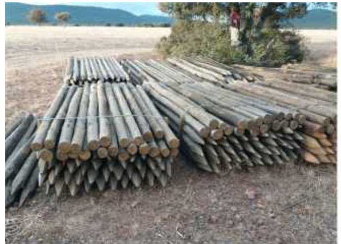
Replanteo del cerramiento