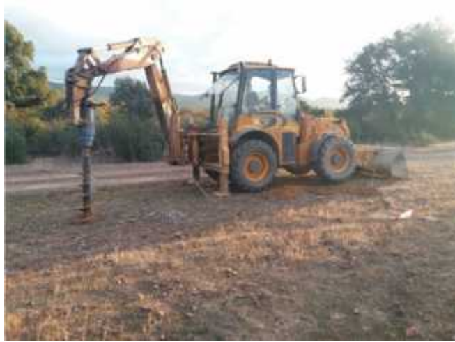
Apertura de hoyos con retro con apero para cerramiento