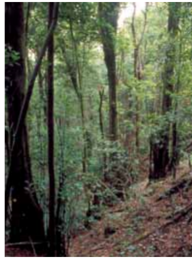
Bosque de viñáticos