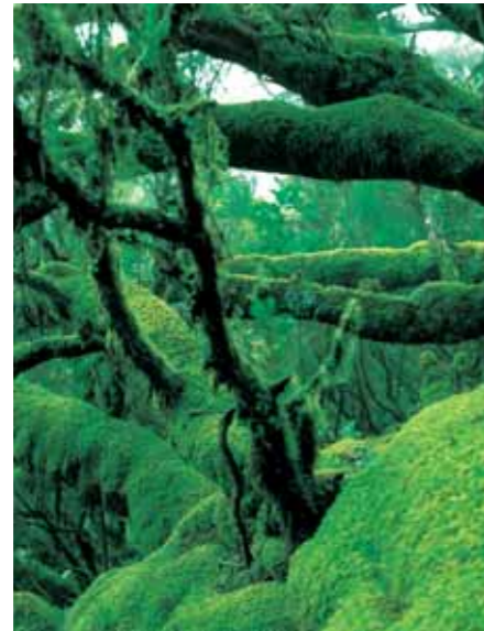
Brezal de cumbre. El monteverde está formado por varios tipos de bosques.

El monteverde representa la gran riqueza excepcional del Parque.