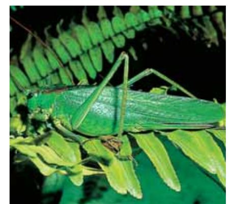
El verde ayuda al mimetismo de las especies.