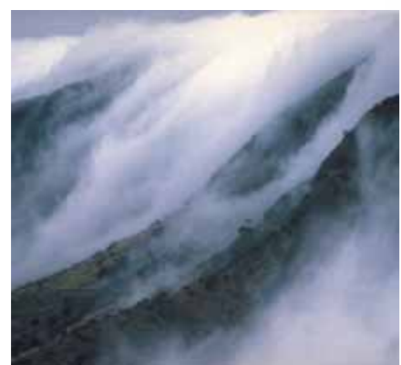
Las nieblas, protagonistas asiduos del monteverde.

La fauna. Garajonay cuenta con una fauna que supera las 1.000 especies catalogadas, de las cuales más de 150 son endémicas del Parque, lo que constituye una concentración de especies exclusivas por unidad de superficie que no se alcanza en ningún lugar de Europa. No obstante, debido a las dificultades de acceso a la colonización procedente del continente, la fauna vertebrada es pobre, con un total de 40 especies que corresponden, en su mayor parte, a las aves. Las palomas turquí y rabiche, endemismos ligados al monteverde, son las especies más sobresalientes. Es de destacar que, aunque la mayor parte de las aves pueden encontrarse en el continente europeo, éstas presentan en muchos casos una cierta diferenciación, alcanzando el rango de subespecie, lo que confiere a la avifauna un notable interés. Los únicos mamíferos autóctonos son cuatro especies de murciélagos que, gracias a su capacidad de vuelo, al igual que las aves, pudieron cruzar el mar que separa el continente africano de las islas. Pero es la fauna invertebrada la que reúne, con diferencia, el mayor número de especies, destacando los insectos, entre los cuales el grupo más numeroso lo forman los coleópteros (escarabajos), seguidos a gran distancia por los arácnidos (arañas) y moluscos (caracoles, babosas,...)