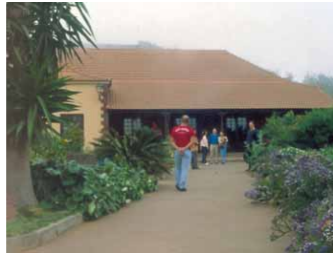
Centro de visitantes