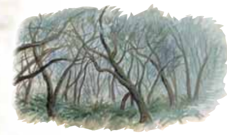
El monteverde constituye la auténtica riqueza arbórea del Parque.