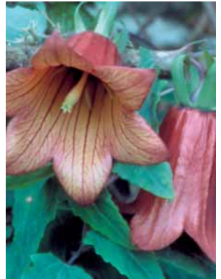
El Biscaya o esquilonera (Canarina canariensis) es un bello endemismo canario ligado al monteverde.