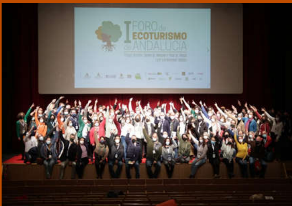
Participantes del I Foro de Ecoturismo en Andalucía.

pnsierranevada.uspublico. dtgr.cagpds @juntadeandalucia.es Telf.: 958 980 246