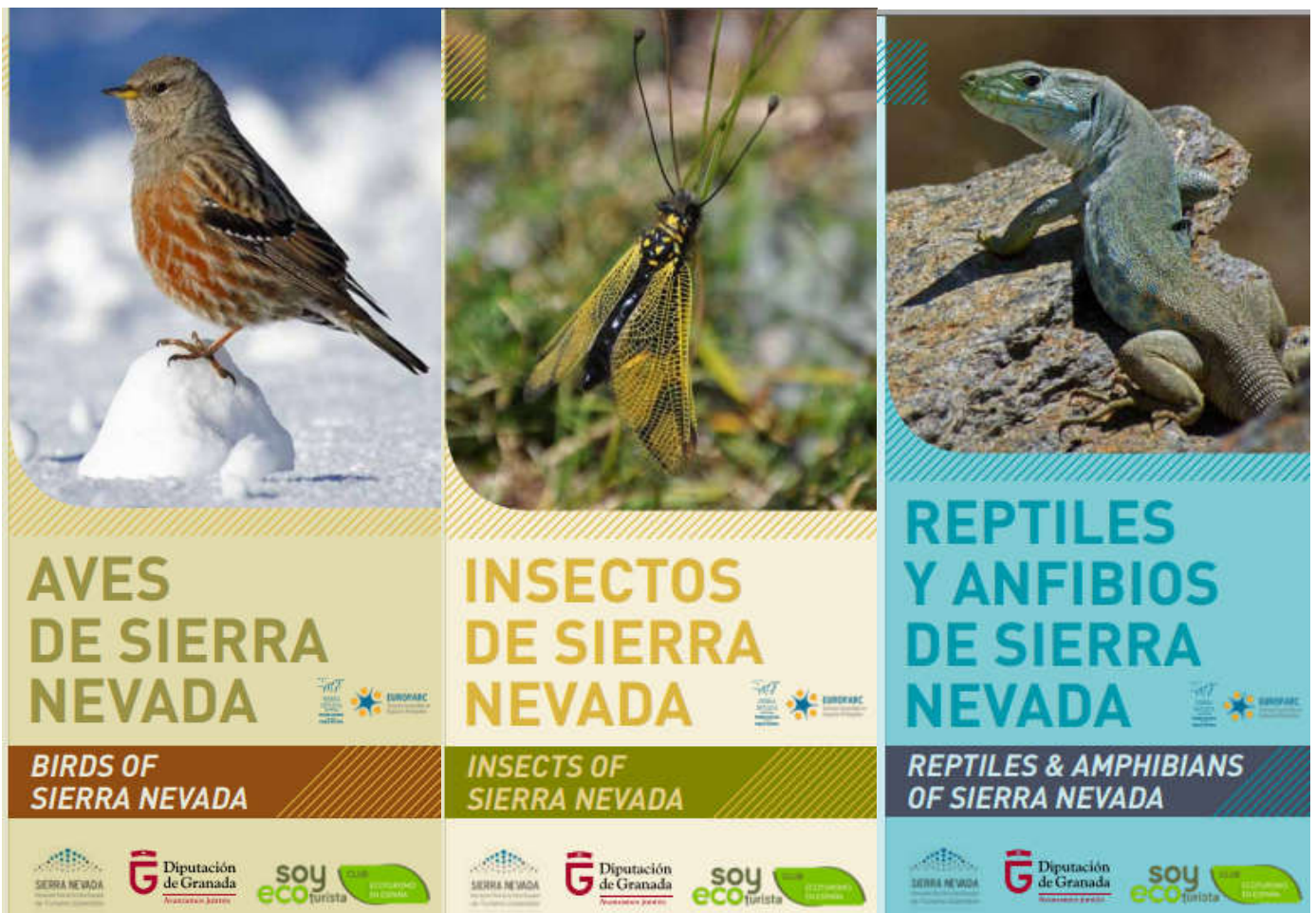
Portadas de los cuadernos

A través del proyecto “Patrimonio Natural como Recurso de Ecoturismo”, subvencionado por la Diputación de Granada, la asociación Foro CETS Sierra Nevada ha realizado una serie de actuaciones con la finalidad de poner en valor los recursos con los que cuenta este espacio natural protegido y fomentar con ello a su conservación.