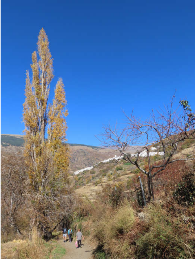
Sendero Pueblos del Poqueira

Para cubrir estos objetivos, el Área de Uso Público de este Espacio Natural dedica tiempo y personal a realizar el seguimiento del estado de los equipamientos de uso público, detectando los deterioros que puedan producirse y promoviendo las mejoras necesarias.