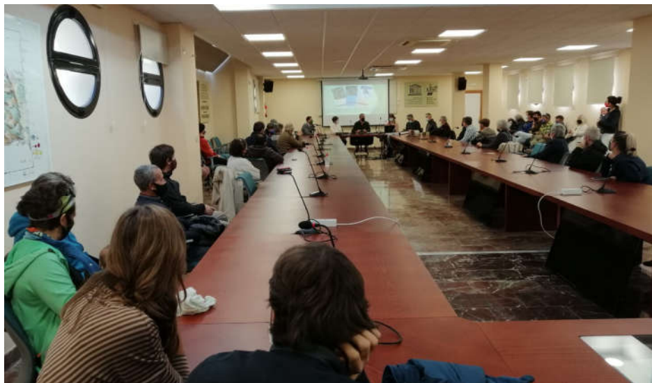
Presentación de los cuadernos.