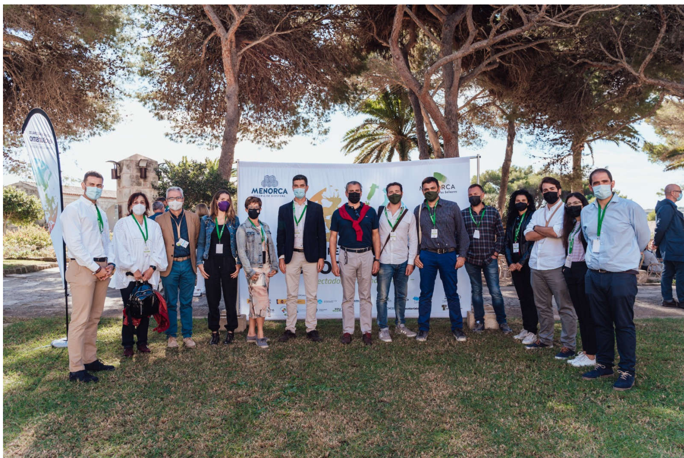
Representación de entidades públicas y privadas de Granada y Almería en el V Congreso Nacional de Ecoturismo.

B ajo el lema “Conectados con la naturaleza”, el V Congreso Nacional de Ecoturismo tuvo lugar del 20 al 22 de octubre de 2021 en Maó y Es Castell (Menorca), con la necesidad de seguir mostrando la importancia y beneficios del producto ecoturismo y su relación con las estrategias nacionales del reto demográfico, cambio climático y economía circular, así como el potencial que tiene España