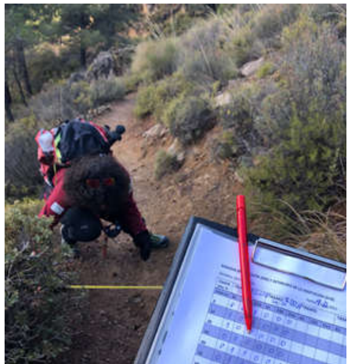
Toma de datos

El protocolo que seguimos consiste en tomar en un número determinado de puntos del trazado las distintas variables: basuras, erosión en laterales del camino y daños detectados