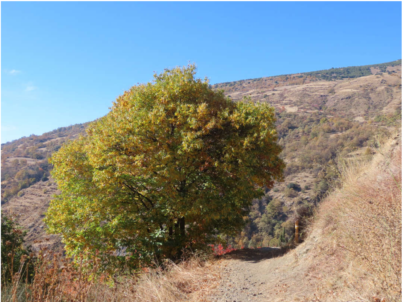
Sendero Pueblos del Poqueira

Los resultados obtenidos en 2021 apuntan a que el protocolo sirve para detectar los cambios a lo largo del tiempo, por lo que se pretende extender al resto de senderos.