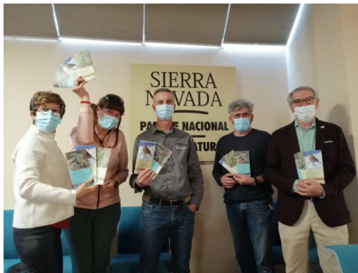
Autores de los cuadernos.