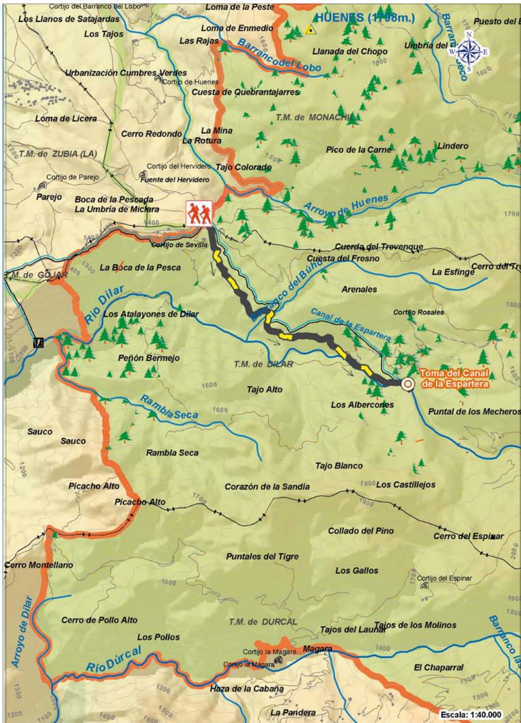
Localización del Itinerario respecto al Límite del Parque Nacional y perfil topográfico.