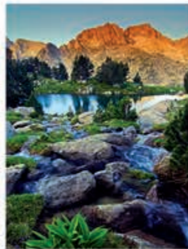
Estany de la Llosa