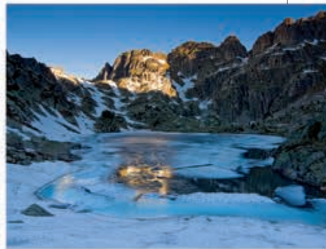
Estany dels Barbs