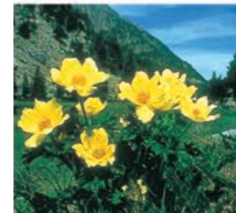
La splendeur des fleurs de haute montagne embellit le paysage.