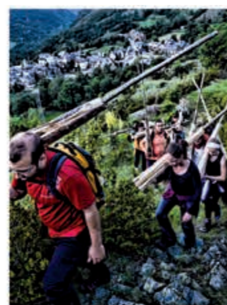
Célébration de la fête des "Falles" dans Boi.