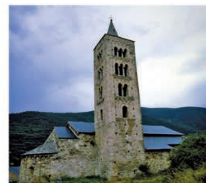
Église de Sant Just et Sant Pastor de Son.