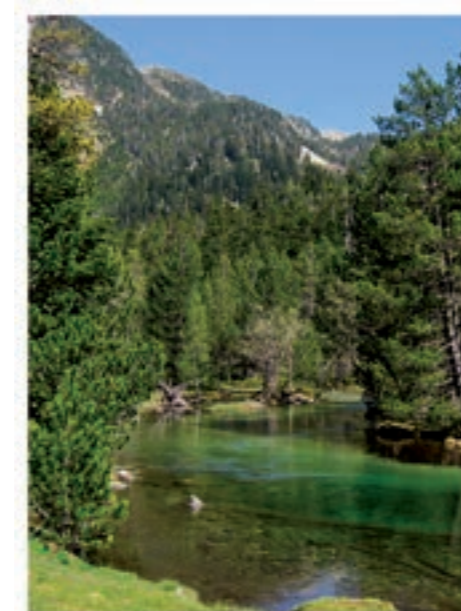
L'eau est présente partout dans le Parc.