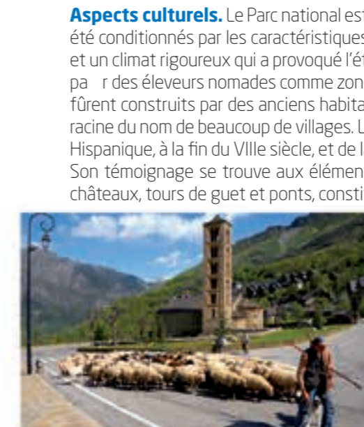
Église de Sant Climent de Taüll, un patrimoine de l'Humanité.

Aspects culturels. Le Parc national est situé dans une zone qui possède un vaste patrimoine historique. Les villages des Pyrénées ont toujours été conditionnés par les caractéristiques géographiques : une orographie extrême qui a fait obstacle aux communications externes et internes, et un climat rigoureux qui a provoqué l'établissement de foyers humains réduits et proches les uns des autres. Au néolithique le parc était utilisé par des éleveurs nomades comme zone de pâturage d'été (il y a environ 9.000 ans). Les premiers établissements permanents dans ces vallées furent construits par des anciens habitants qui parlaient une vieille langue préromane, l'ibéro-basque, qui s'est conservée jusqu'à nos jours à la racine du nom de beaucoup de villages. La romanisation a laissé quelques claires évidences dans le val d'Aran. Après l'établissement de la Marque Hispanique, à la fin du VIIIe siècle, et de la formation des comtés pyrénéens, à la fin du IXe siècle un fort courant politique et religieux est apparu. Son témoignage se trouve aux éléments culturels de l'art roman : églises ornées de sculptures et de fresques, sveltes clochers, monastères, châteaux, tours de guet et ponts, constituent un patrimoine artistique unique parfaitement intégré au paysage qui l'entoure