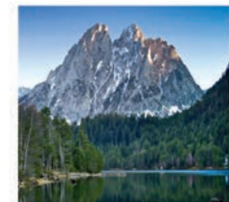
Les pics des Encantats sont l'un des emblèmes du Parc.