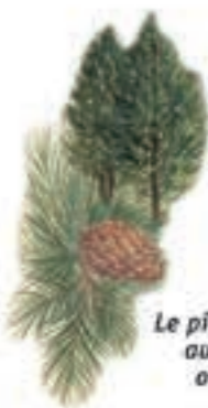
Le pin à crochets résiste aux intempéries et on le trouve près des sommets.