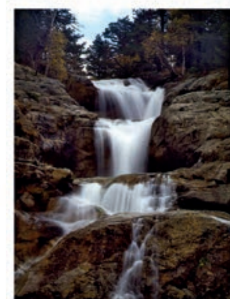
Cascade de Sant Esperit.