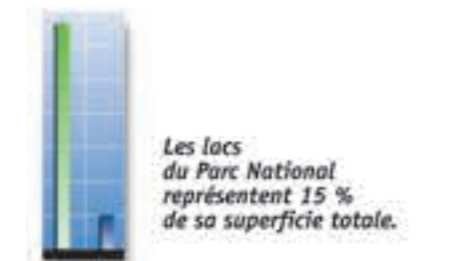
Les lacs du Parc National représentent 15 % de sa superficie totale.