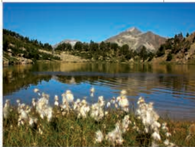
Estany de Besiberri