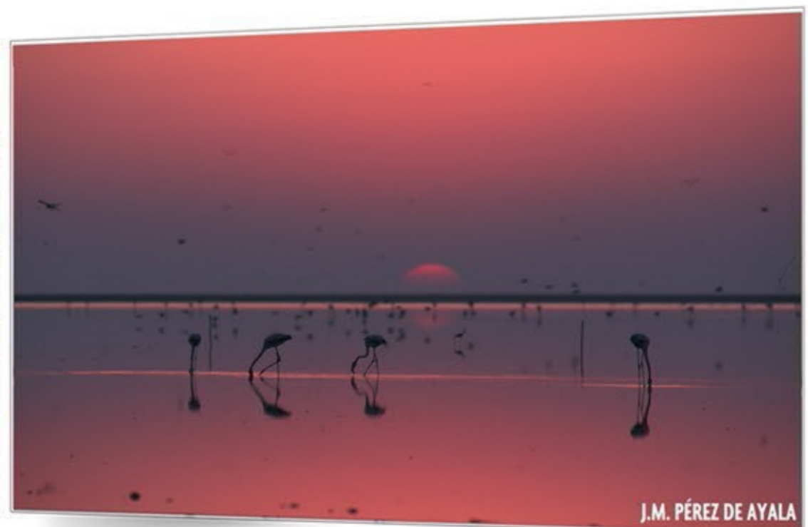
Mosaico vivo DOÑANA