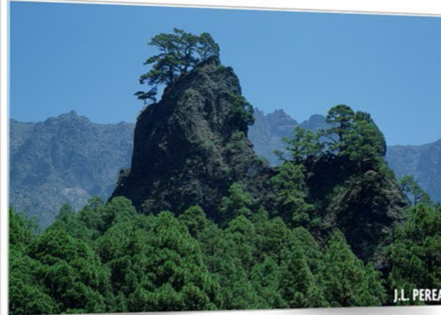
Riscos imposibles CALDERA DE TABURIENTE