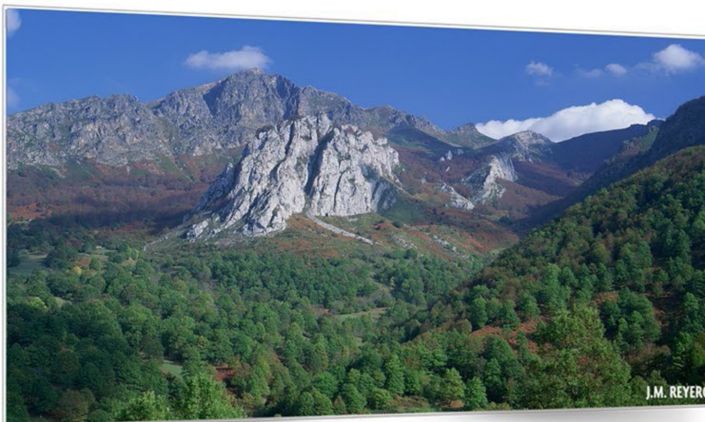
Naturaleza y gentes PICOS DE EUROPA