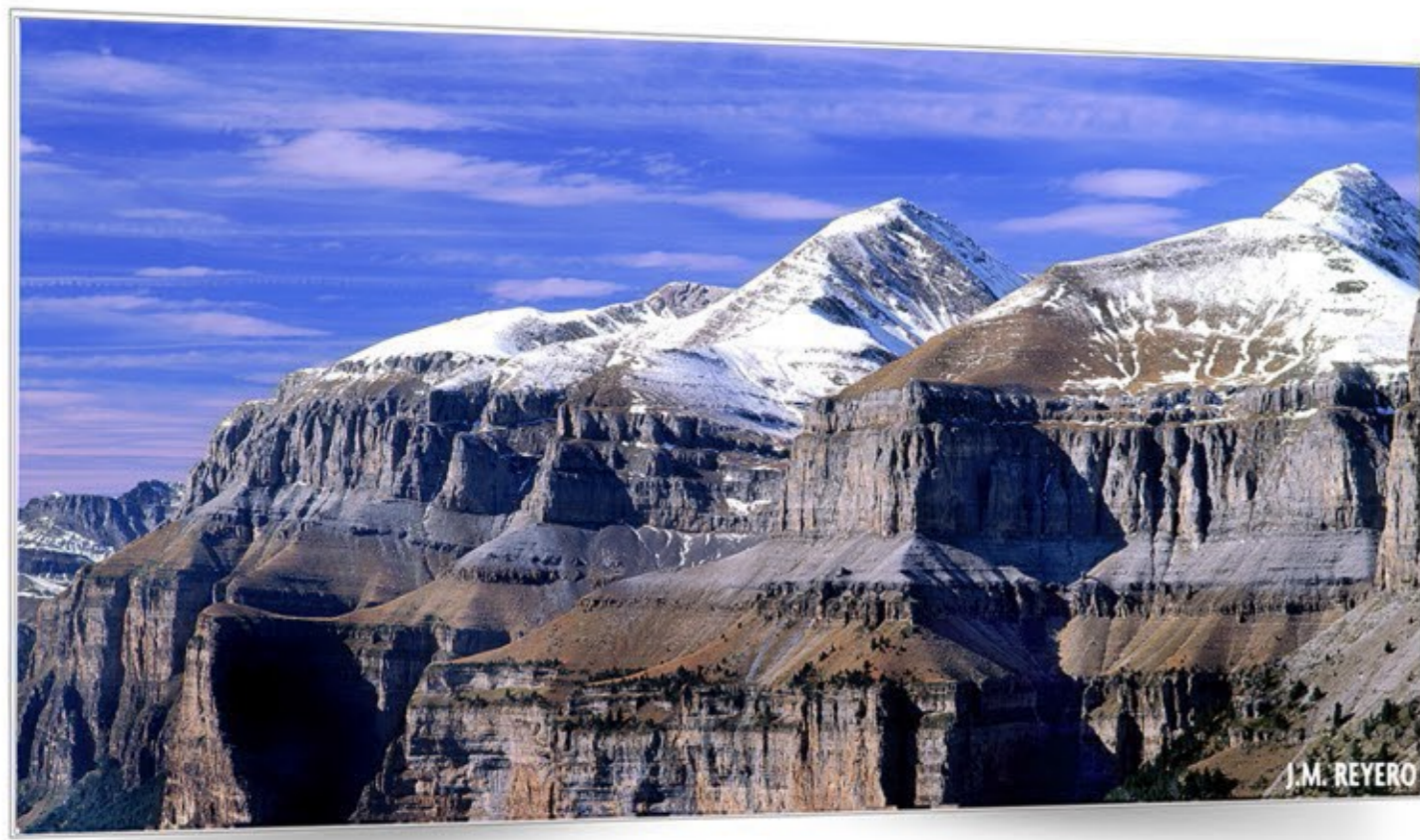
Balcones al cielo ORDESA Y MONTE PERDIDO