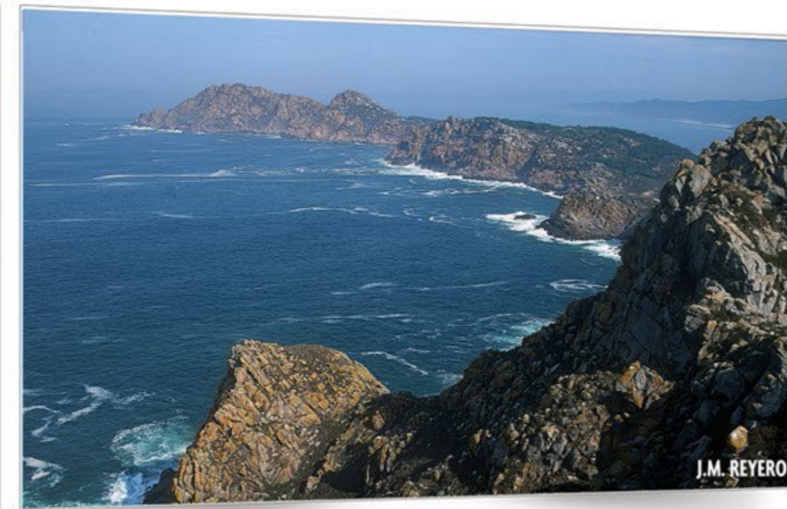
Vigías del Atlántico ISLAS ATLÁNTICAS DE GALICIA