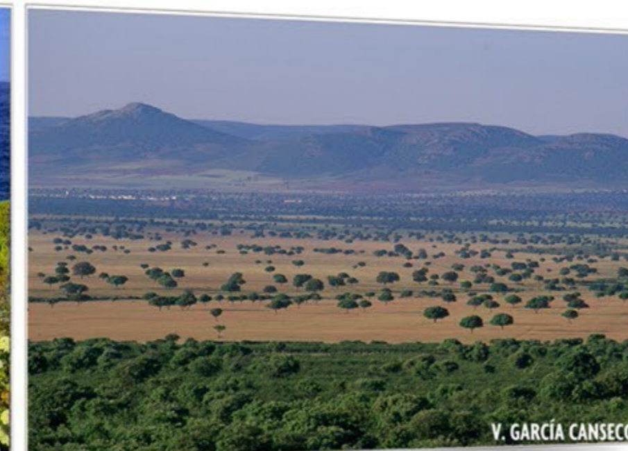
Horizontes infinitos CABAÑEROS