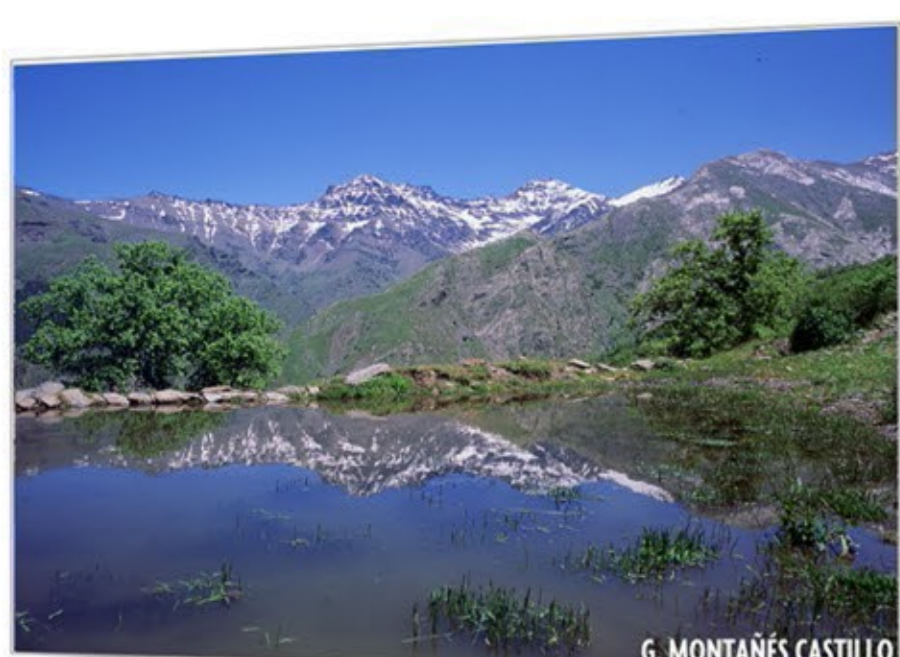
Vida en las cumbres SIERRA NEVADA