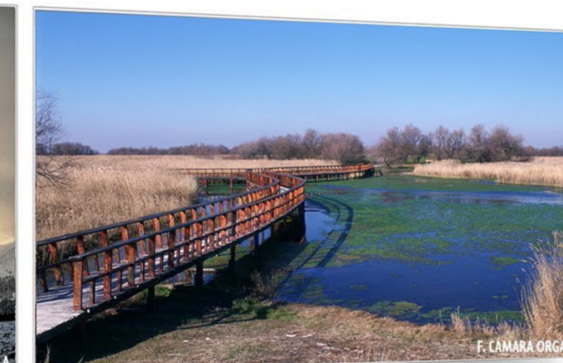
El milagro del agua LAS TABLAS DE DAIMIEL