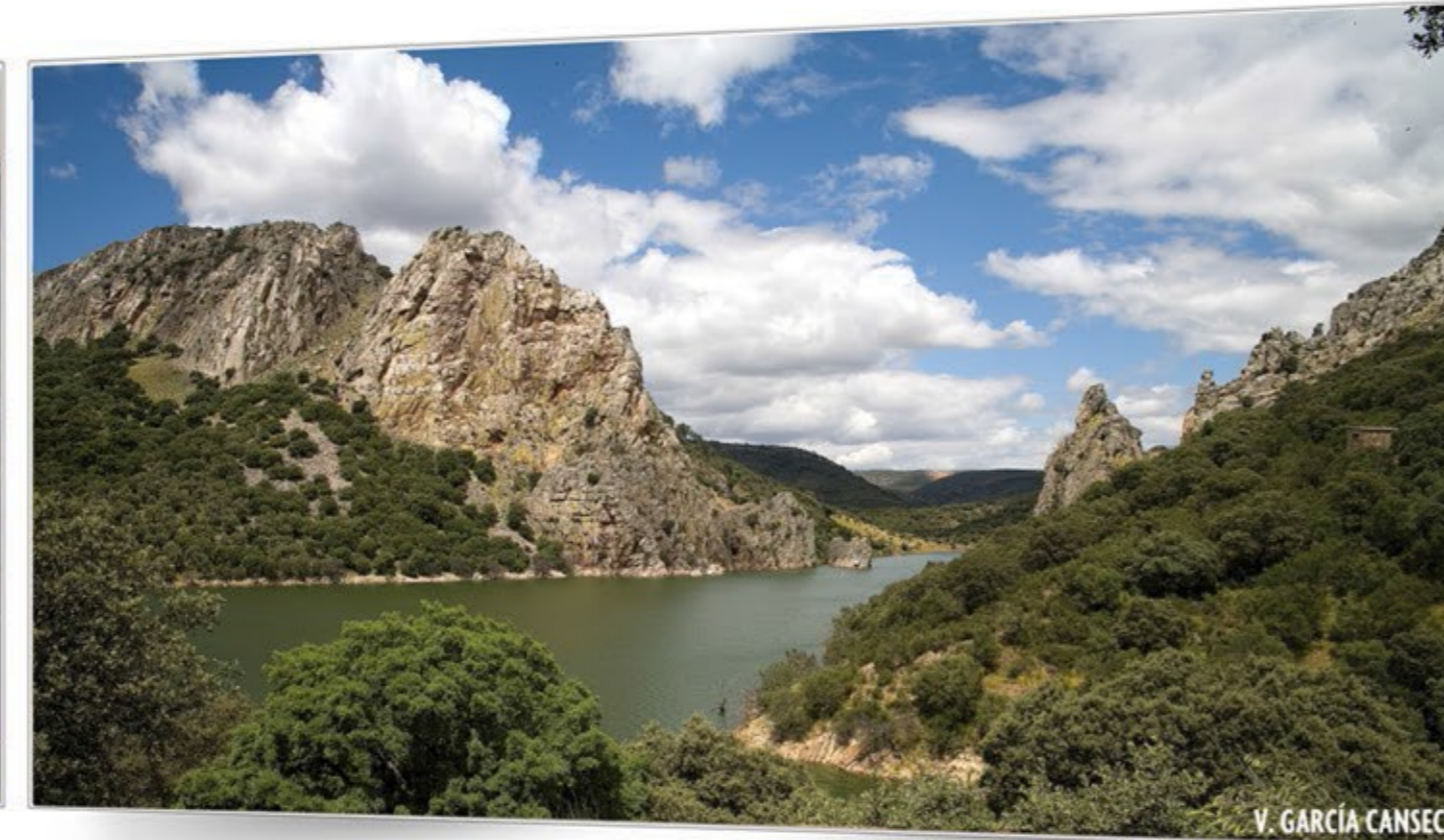
Un mundo alado MONFRAGÜE