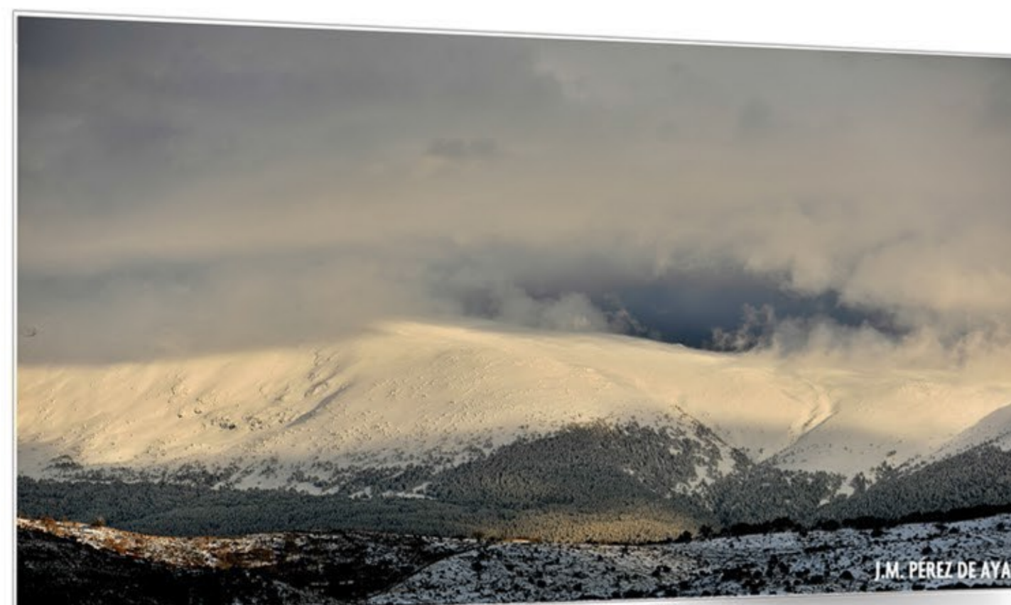
Las cumbres dormidas SIERRA DE GUADARRAMA