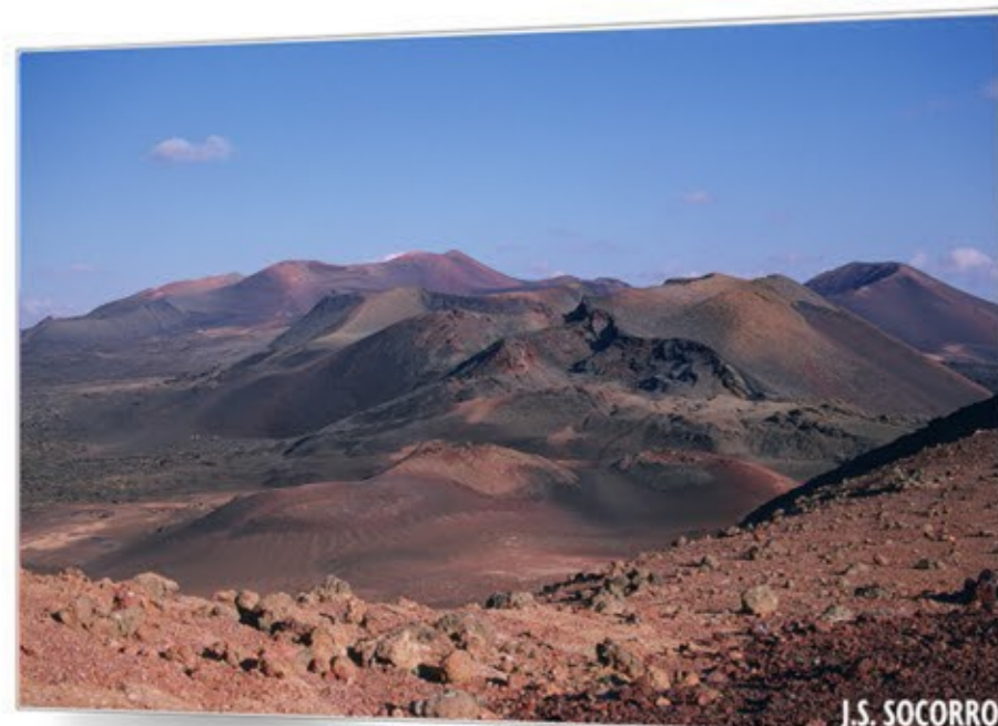
Detenido en el tiempo TIMANFAYA