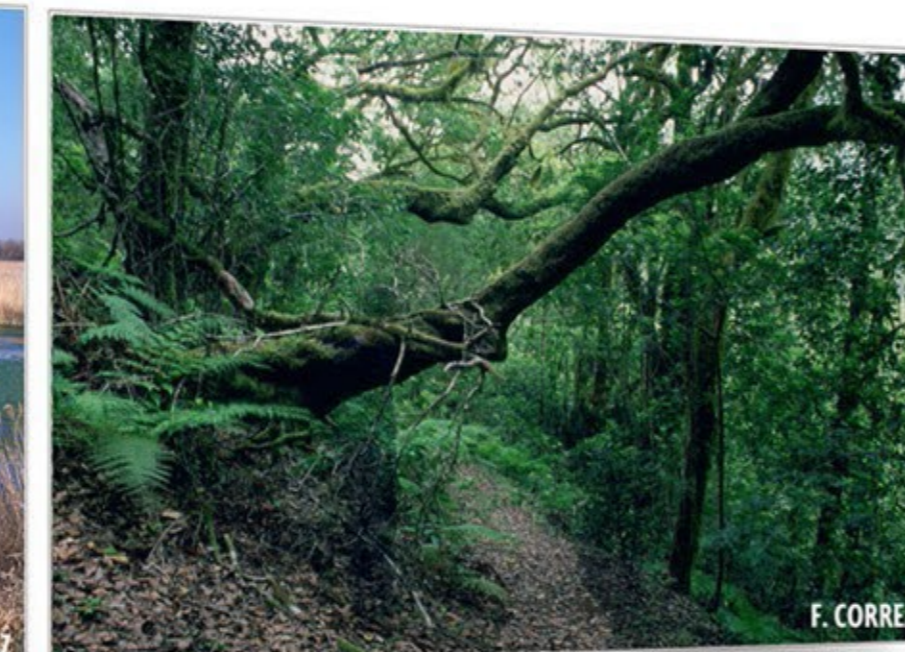
Recuerdos mágicos GARAJONAY