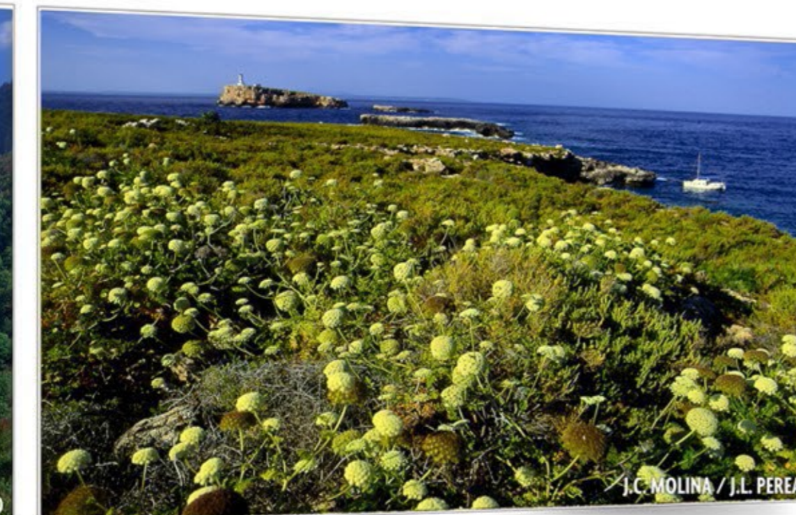
Transparencia marina ARCHIPIÉLAGO DE CABRERA