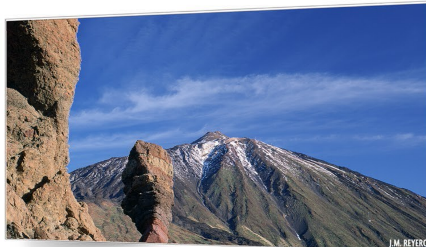
A la sombra del volcán TEIDE