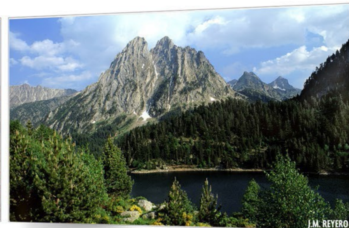
Tierra de lagos AIGÜESTORTES I ESTANY DE SANT MAURICI