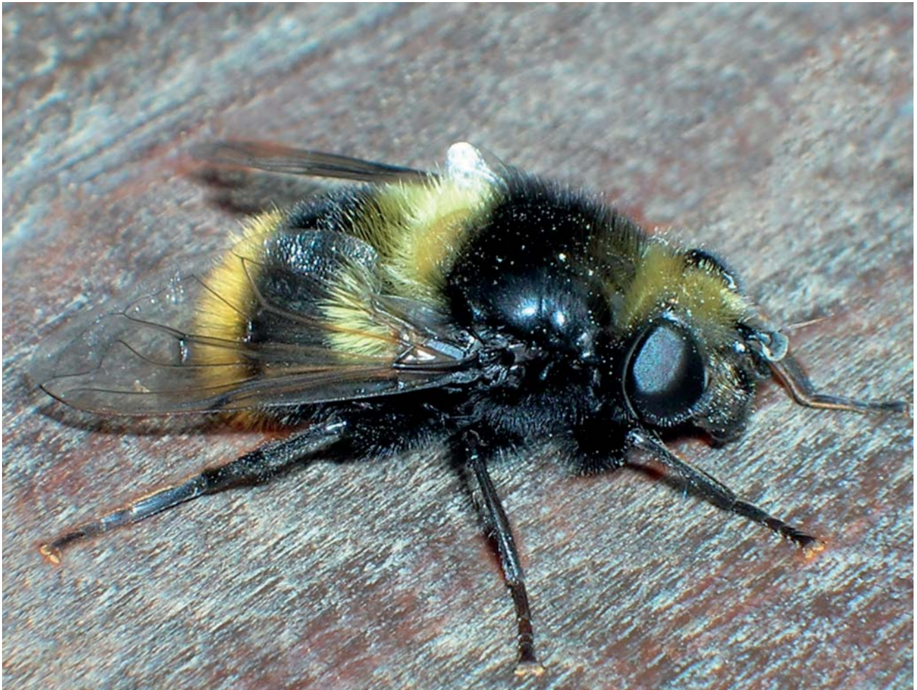
Foto 3. Mallota fuciformis (Fabricius, 1794), sírfido saproxílico presente en el Parque Nacional de Cabañeros. Es una de las especies europeas de Mallota cuya larva se desconoce.