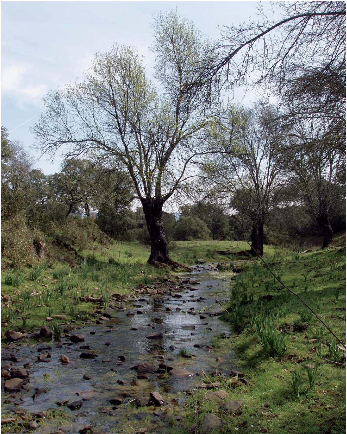
Foto 1. Formación riparia de fresnos ( Fraxinus angustifolia ) en el Parque Nacional de Cabañeros (España). Es el hábitat donde mayor número de especies de sírfidos saproxílicos se han hallado.