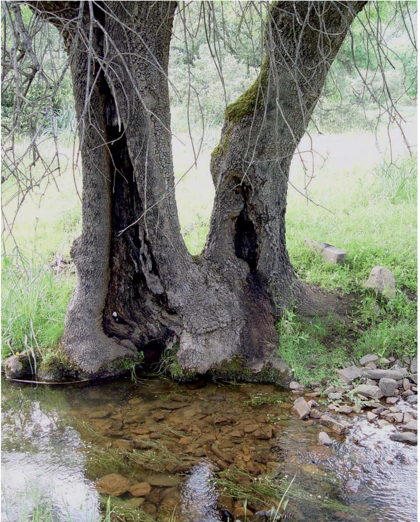
Foto 2. Fresno ( Fraxinus angustifolia ) maduro con oquedades en el Parque Nacional de Cabañeros (España). Muchos sírfidos y otros insectos saproxílicos utilizan las oquedades de árboles para el desarrollo de sus fases inmaduras.

Photo 2. Mature ash tree ( Fraxinus angustifolia ) showing holes in Cabañeros National Park, central Spain. Inmature stages of many hoverfly species and other saproxylic insects live in tree holes.