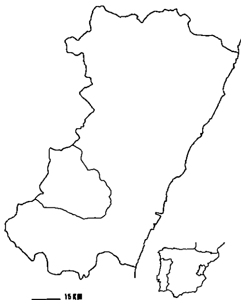
Fig. 1. Localización de la comarca natural del Alto Mijares en la provincia de Castellón.

adentra hacia el interior del territorio siguiendo el curso del propio río Mijares y el cauce del río Villahermosa. El piso Mesomediterráneo ocupa, de una forma continua, la mayor parte de la zona de estudio. El piso Supramediterráneo se presenta en la zona sur de forma muy localizada (Espadán), siendo el monte de Santa Bárbara de Pina (perteneciente ya al Alto Palancia) donde ocupa una mayor extensión, y en su sector Norte (términos de Zucaina y Cortes de Arenoso). El piso Oromediterráneo se presenta muy localizado, y de forma topográfica en el pico Las Cruces (1.700 msnm). El ombroclima dominante es el seco, excepto en la zona nuclear de Espadán y en buena parte del área supramediterránea del Norte del territorio, por no superar los 600 mm de precipitación anuales, aunque en algunos enclaves del territorio aparezca el ombroclima subhúmedo de forma local.