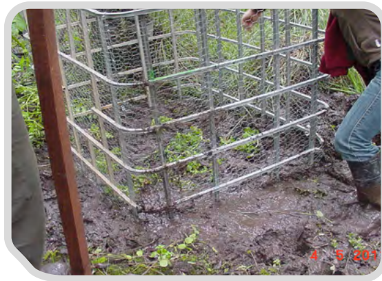
Reforzamiento de Hydrocharis morsus ranae en la Retuerta de Doñana (arriba derecha), y de Rorippa valdes bermejoi en el Arroyo de la Rocina (abajo) e instalación de sendos cercados de protección.

En el marco del Proyecto LIFE CONHABIT ANDALUCÍA (2014-2019) se elaboró el “Manual de Orientaciones Silvícolas del Espacio Natural de Doñana”, con fichas de la especies amenazadas, para evitar impactos de las actuaciones forestales.