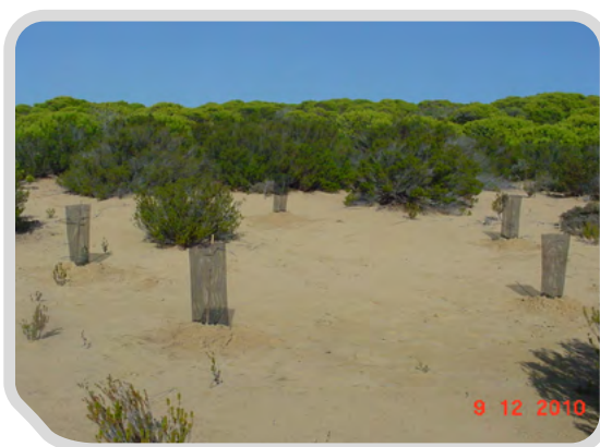
Marcaje de ejemplares del cardo Onopordum hinojense (EN) dentro de un cercado de protección contra la herbivoría (izquierda), y repoblación de Juniperus oxycedrus macrocarpa en dunas del Parque Natural (derecha)

Entre las especies higrófilas resaltan el reforzamiento realizado en 2011 del macrófito flotante Hydrocharis morsus ranae , que tiene en Doñana la más meridional de las poblaciones europeas , y de una rara crucífera que vive únicamente en los bordes del arroyo de La Rocina, Rorippa valdes bermejoi , ambas En Peligro de Extinción, a partir de ejemplares cultivados en el Laboratorio Andaluz de Propagación Vegetal.