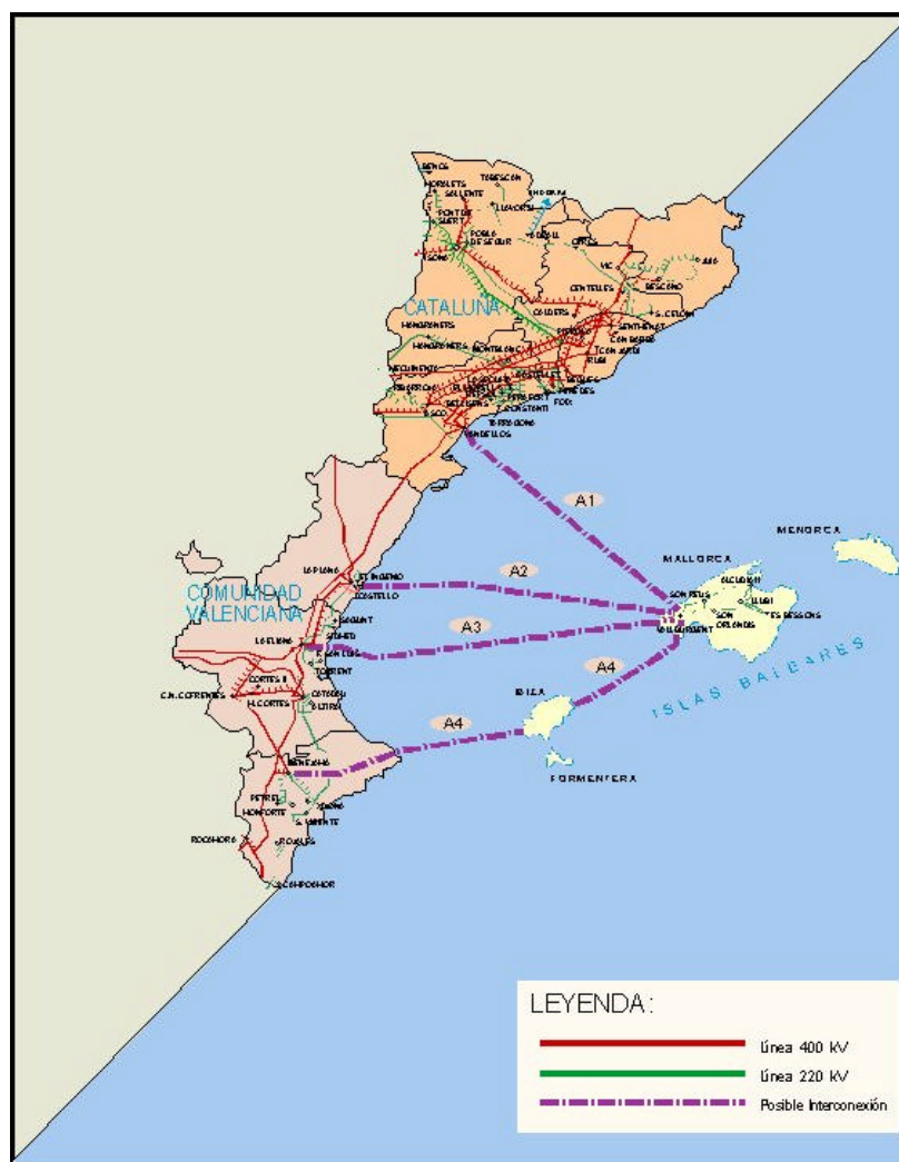
Figura 7.1.- Alternativas de interconexión de Baleares con la Península.

La conexión Sur (A4) y relacionado con su paso obligado por Ibiza, se considera como un eje incuestionable de conexión. Sí podrían admitirse alternativas de conexión desde Ibiza a la Península pero estas últimas no se contemplan en este documento.