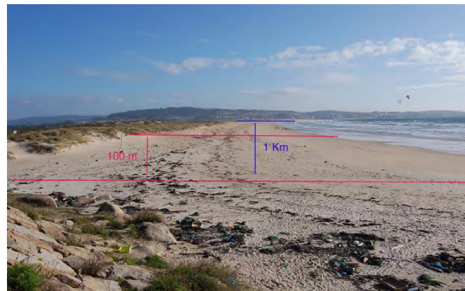
Franjas de muestreo de 100 m y de 1 Km. 6

Para cada una de estas unidades de muestreo se ha desarrollado un formulario de campo. Ambas franjas se deben muestrear de forma independiente, teniendo en cuenta la zona de solape. Las coordenadas geográficas de los puntos de comienzo y de finalización de la unidad de muestreo están debidamente establecidas debiéndose mantener para que en los muestreos siguientes se hagan siempre en el mismo sitio.