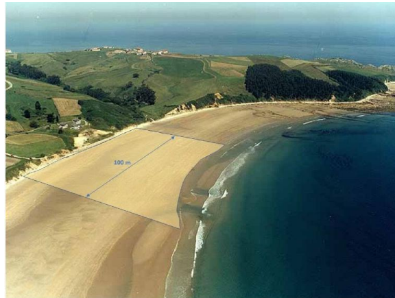
Unidad de muestreo de 100 m. 5

Los objetos de más de 50 cm. muestreados en la franja de 100 m. deberán reflejarse también en el cómputo del transecto de 1.000 m.