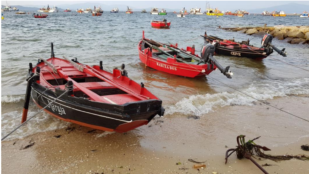
Dornas en la Isla de Arosa