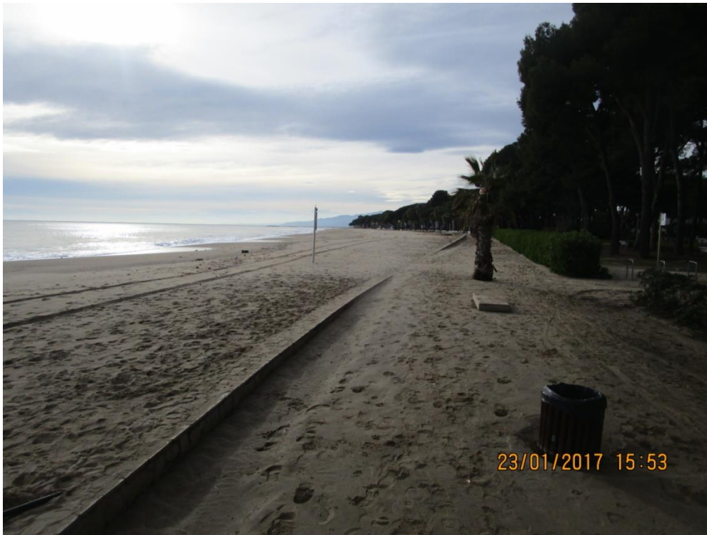
PASEO DE CAMBRILS.