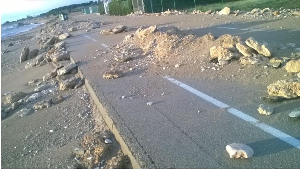
PASEO EN ALCANAR.