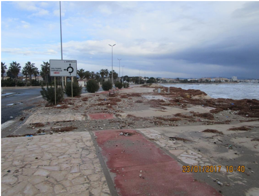
PASEO DE L'AMPOLLA.