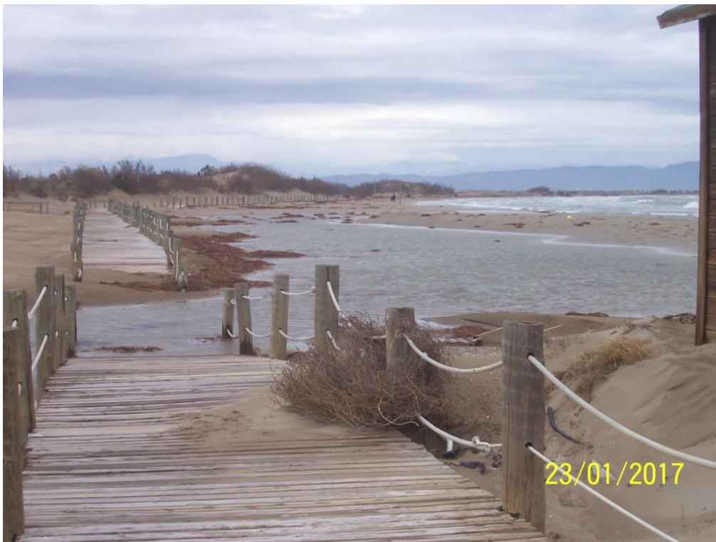
PASEO EN DELTEBRE.