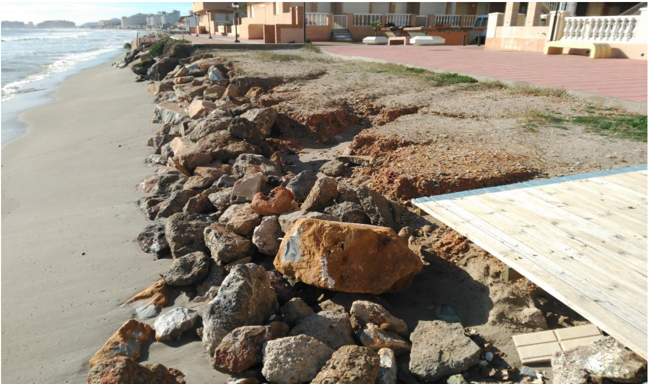
Playa Ensenada del Esparto