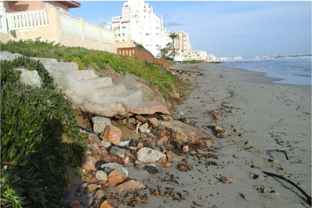
Playa del Pedrucho