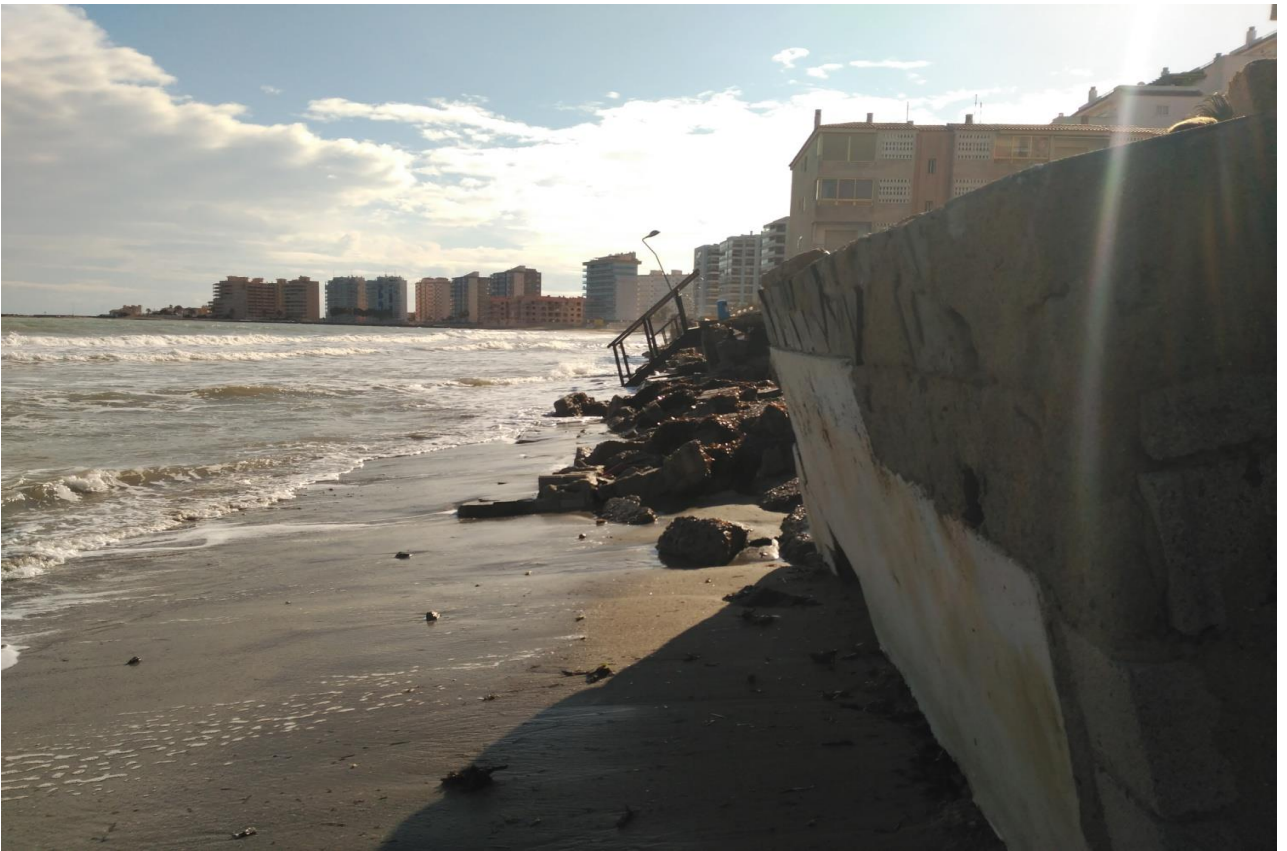
Playa del Pudrimel