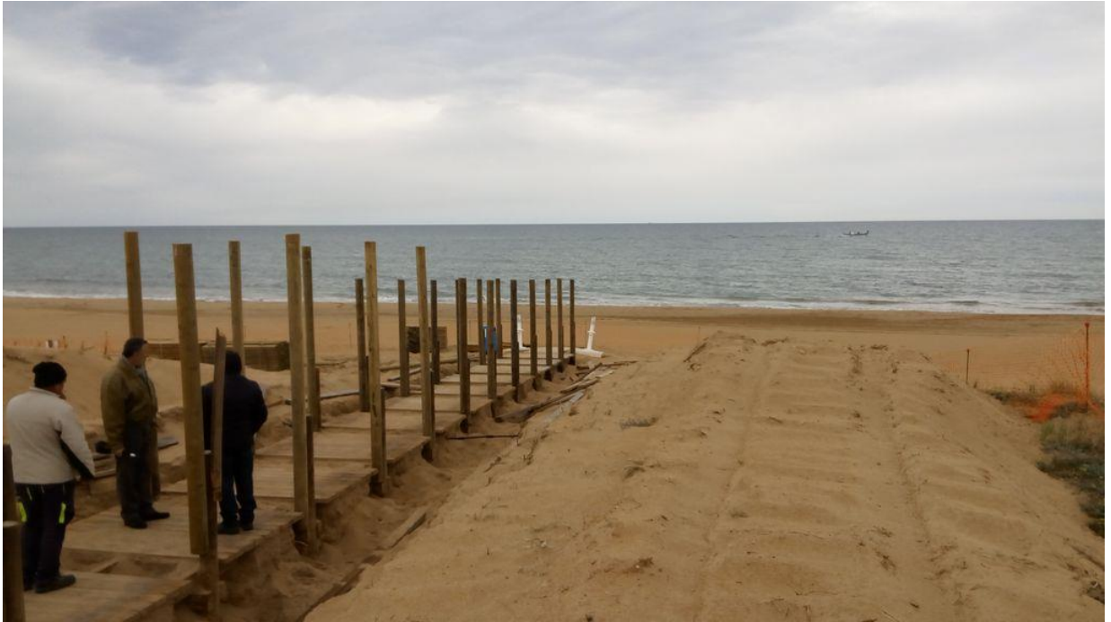
Después de las obras