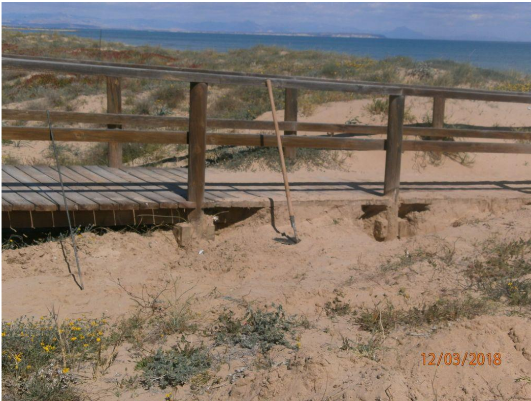
Durante las obras