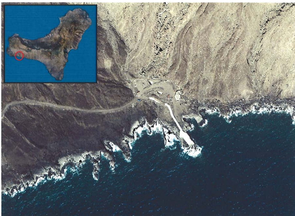
Figura 28. Playa del Muellito de Orchilla (Isla de El Hierro).