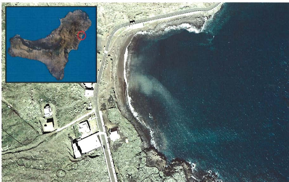
Figura 114. Playa de Timijirique (Isla de El Hierro).