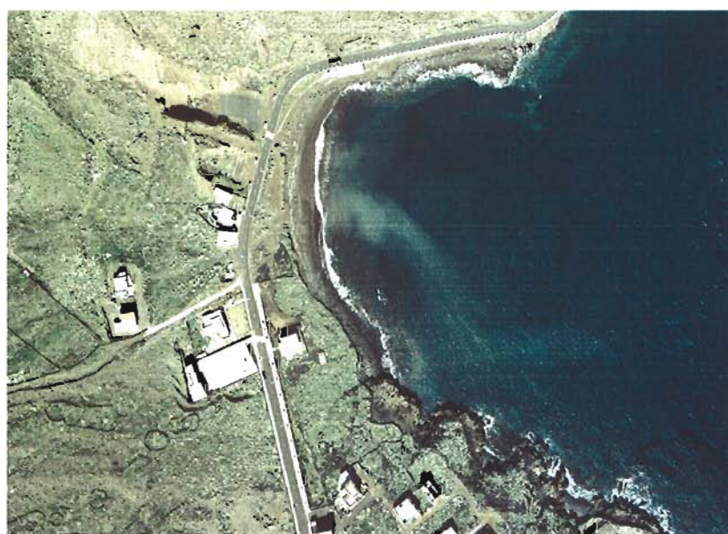
Figura 117. Año 2003