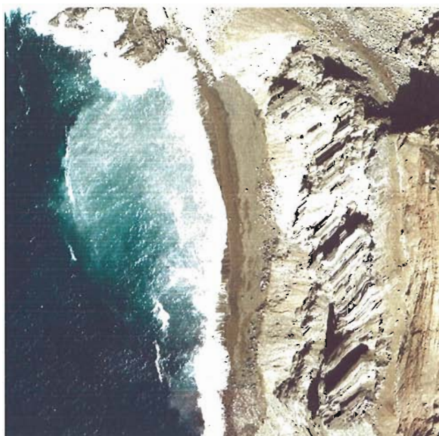
Figura 36. Año 2003