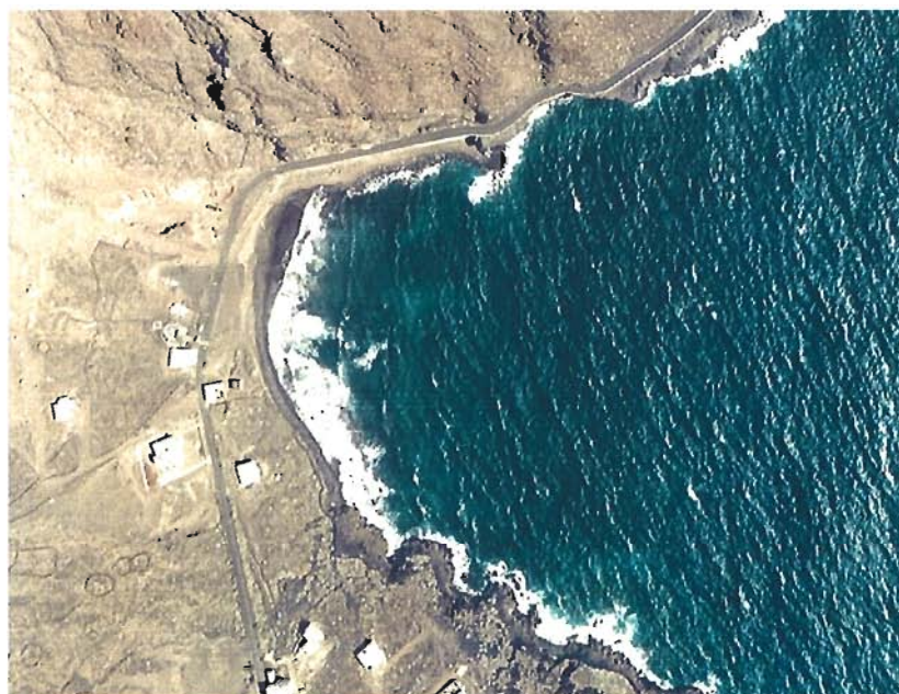
Figura 116. Año 1989