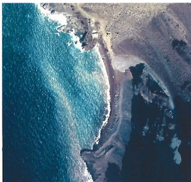
Figura 35. Año 1989