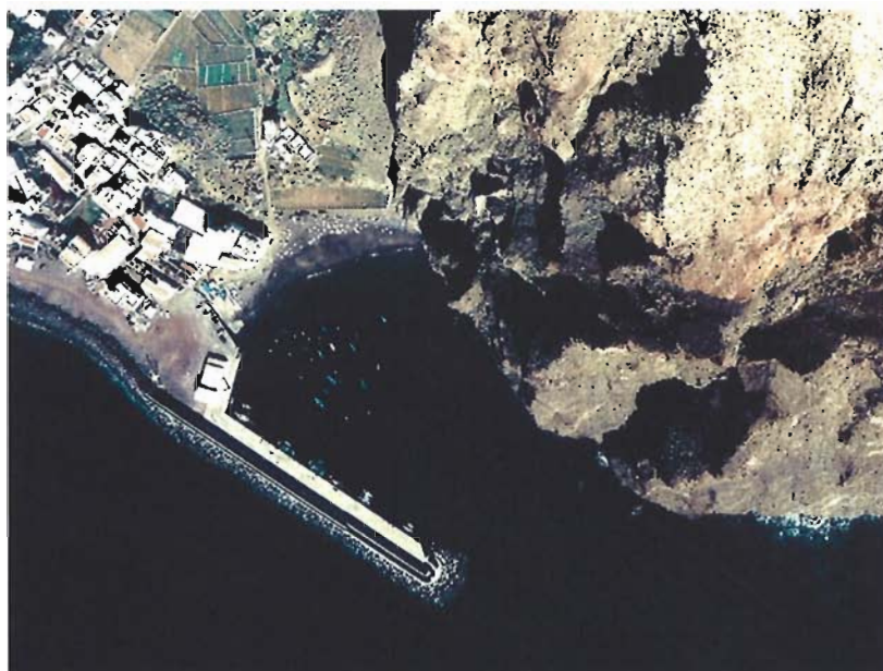
Figura 165. Año 1989