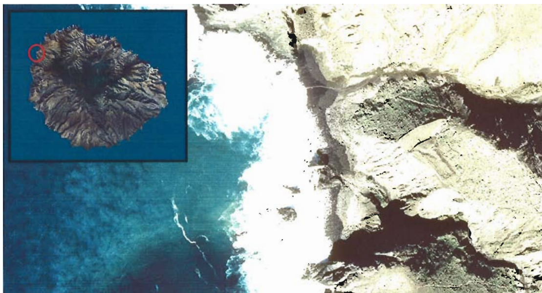
Figura 139. Playa del Trigo (Isla de La Gomera).