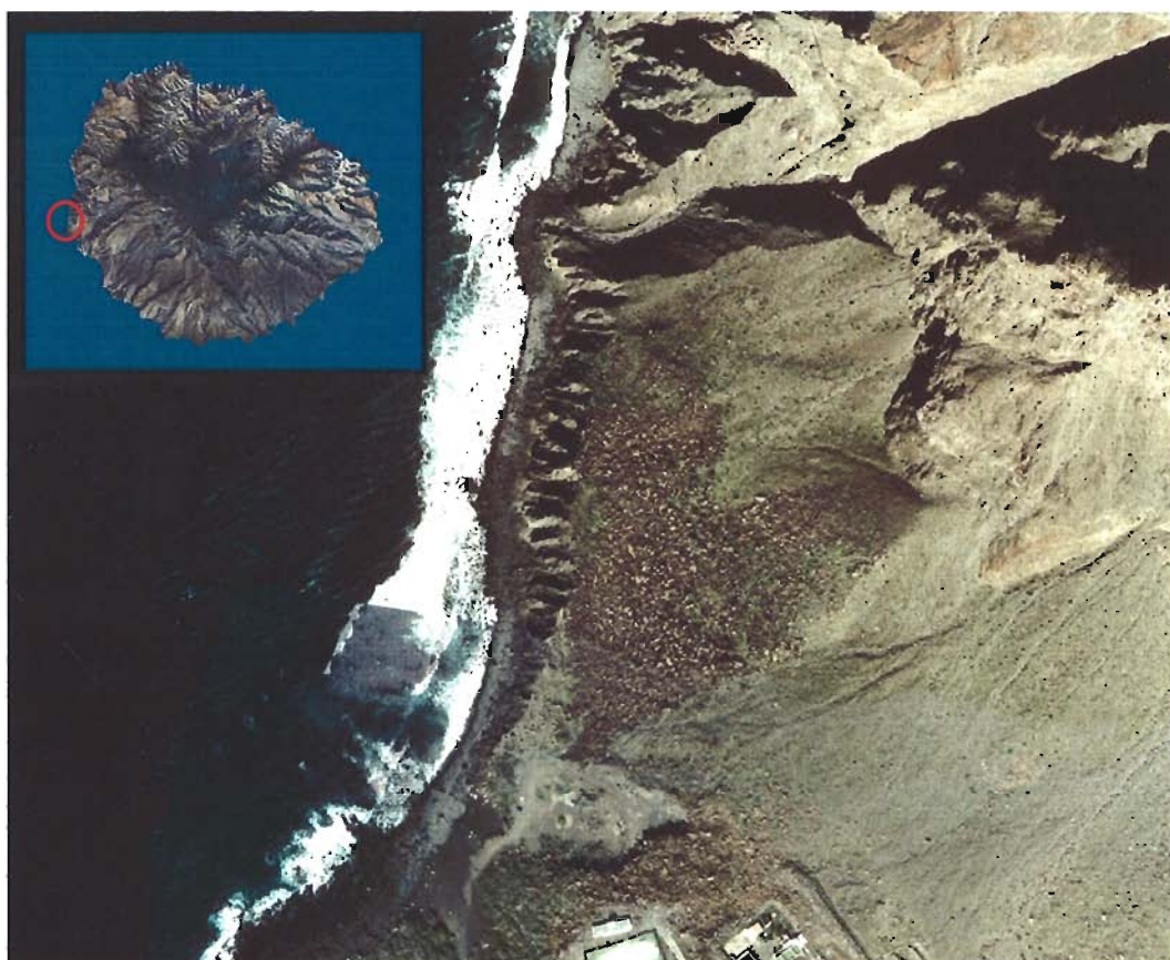
Figura 187. Playa de El Inglés (Isla de La Gomera).