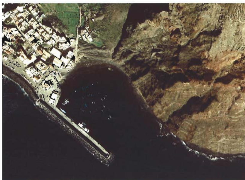
Figura 166. Año 2003