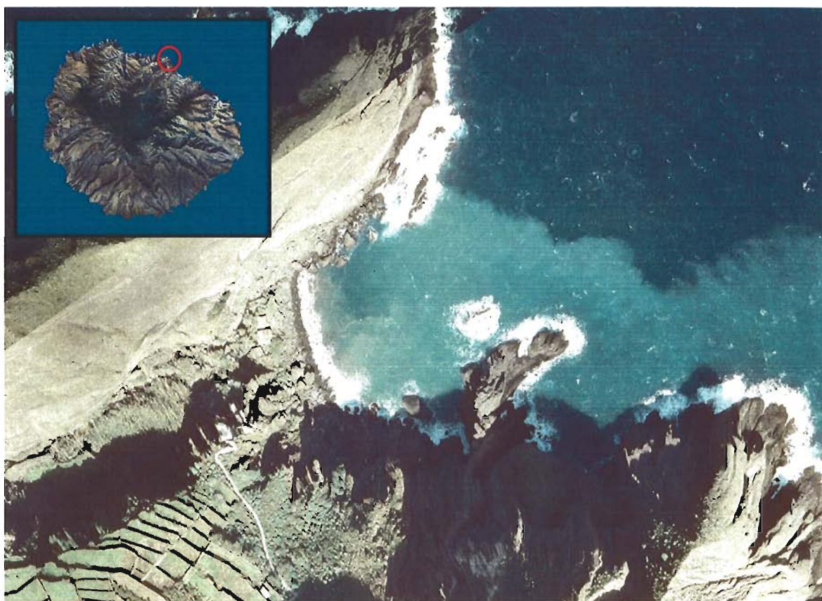
Figura 1. Playa de San Marcos (Isla de La Gomera).