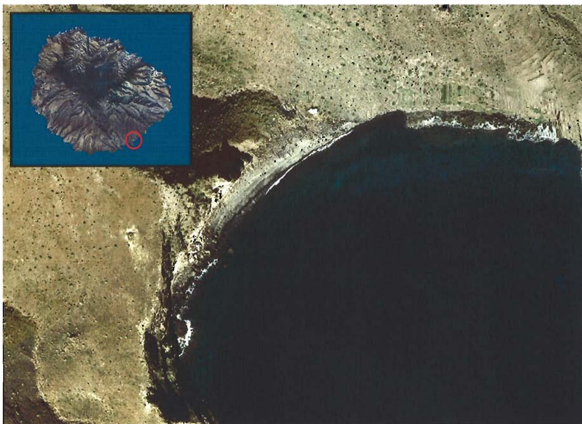
Figura 68. Playa de Suárez (Isla de La Gomera).