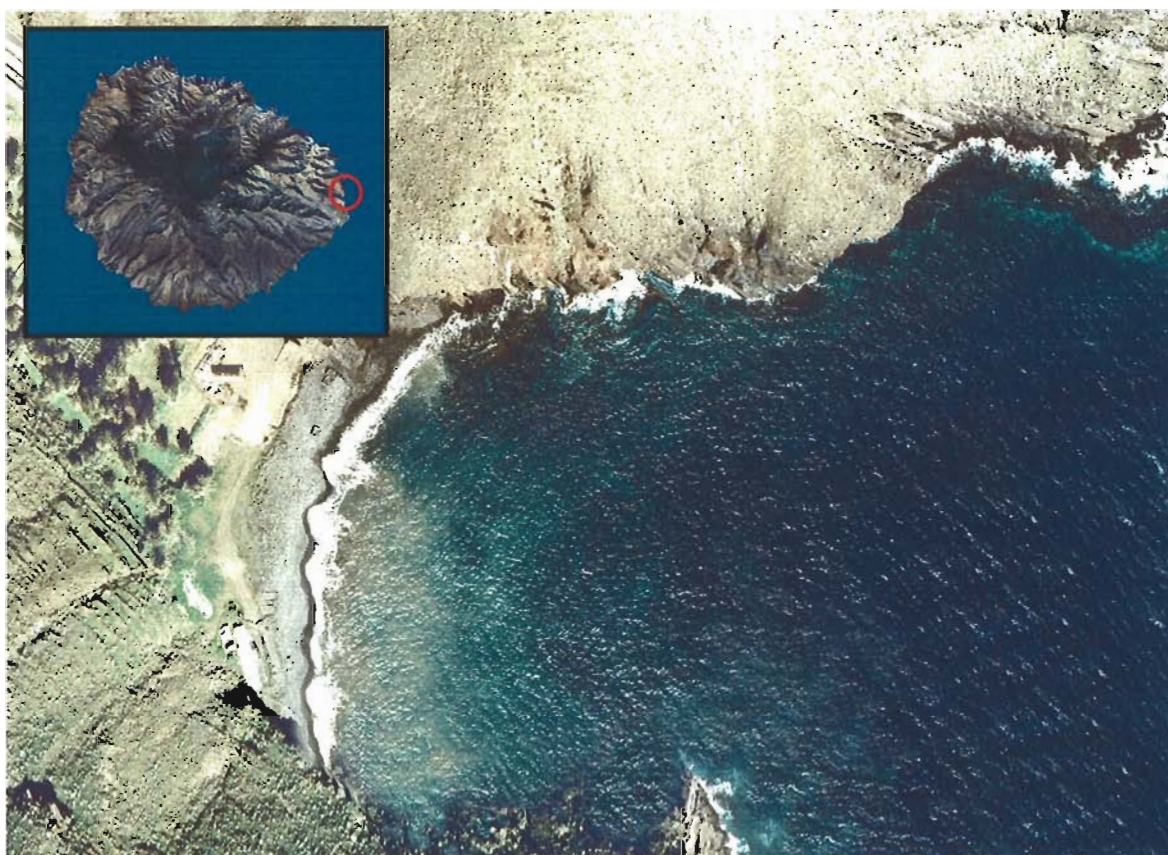
Figura 21. Playa de Avalo (Isla de La Gomera).