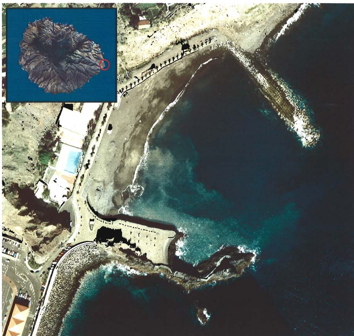
Figura 28. Playa de La Cueva (Isla de La Gomera).