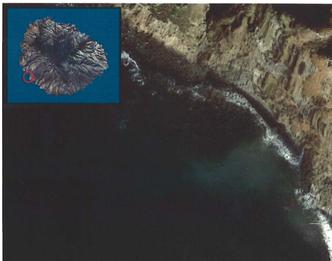
Figura 117. Playa de La Arena (Isla de La Gomera).