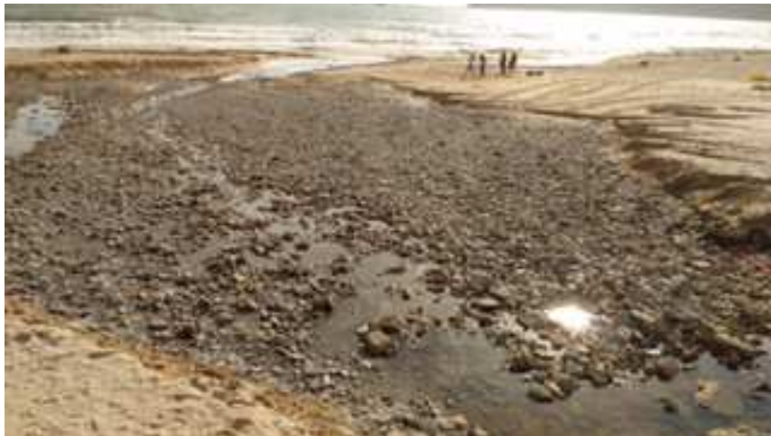
Playa de Getares