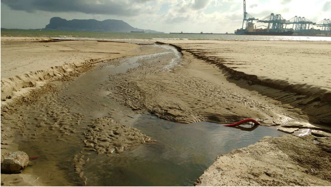
Play de El Rinconcillo (Algeciras)