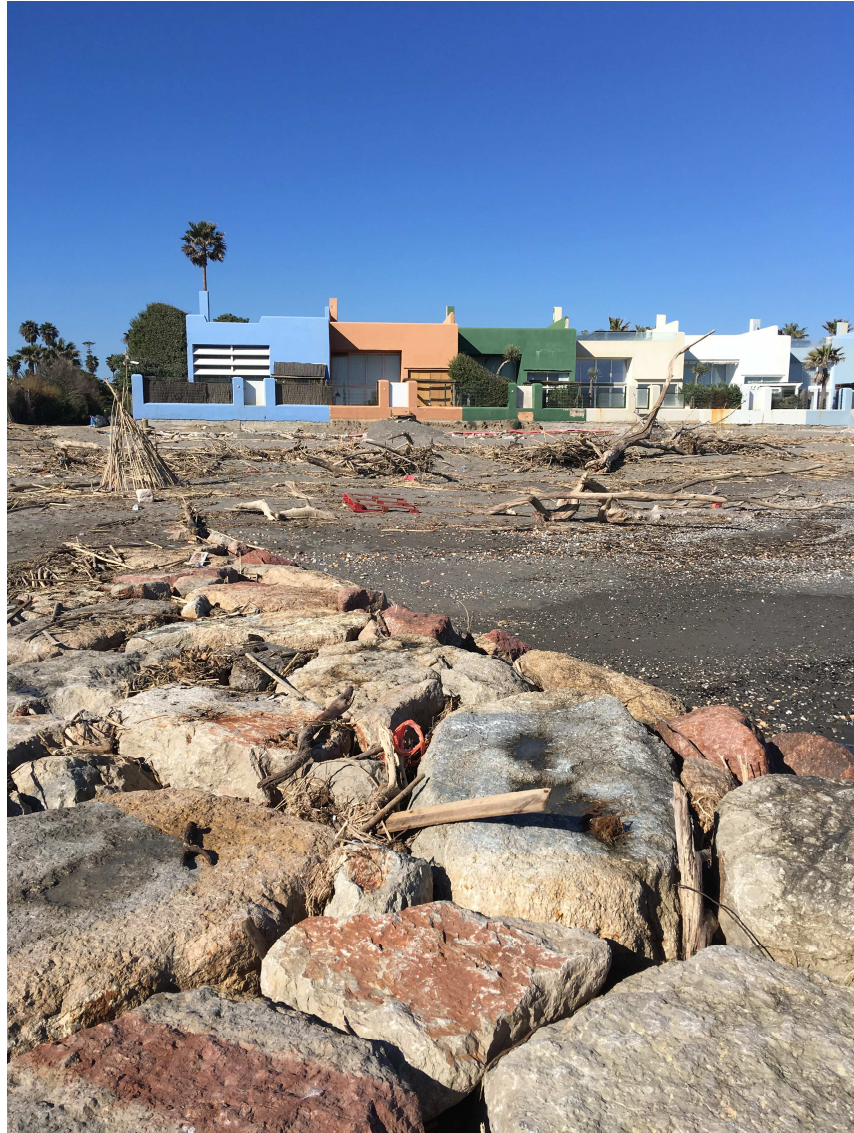
Playa de Sotogrande