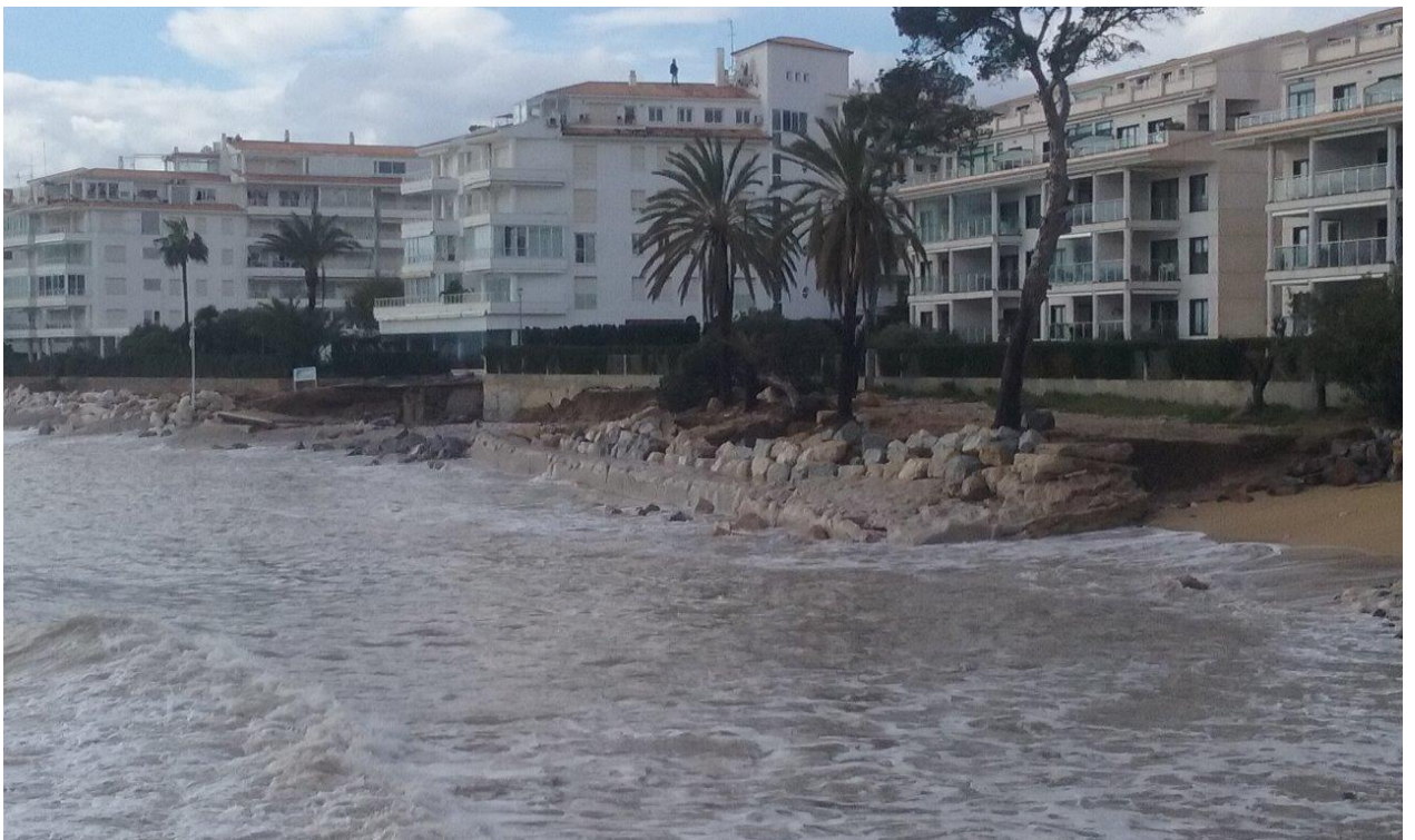
PLAYA CAP NEGRET. ALTEA