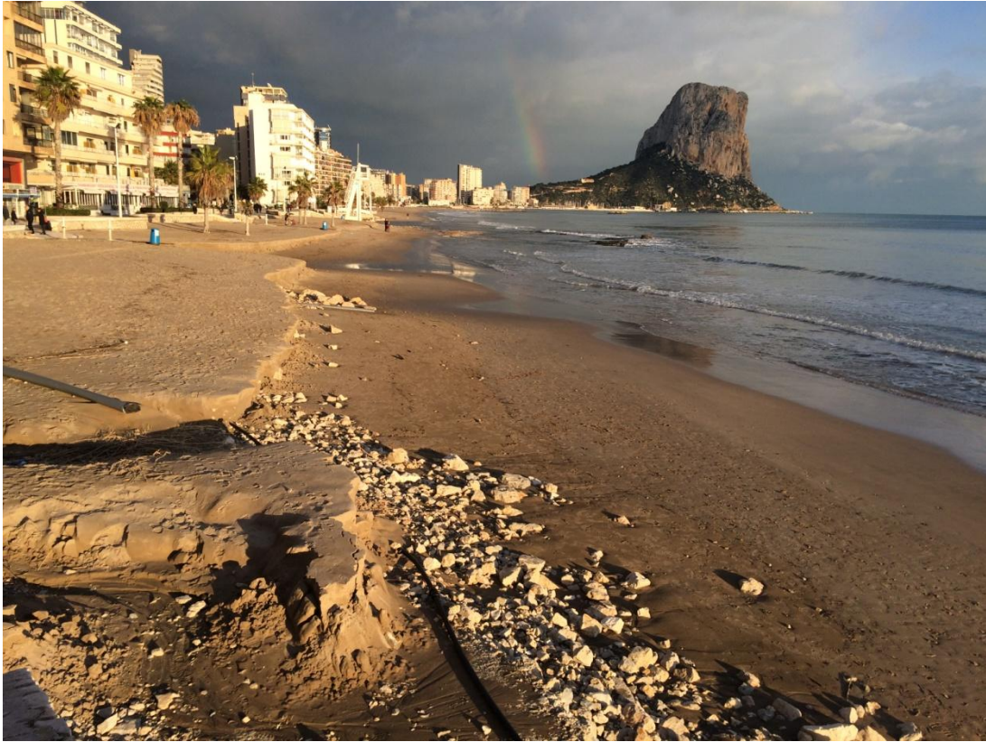
PLAYA DE EL ARENAL. CALPE