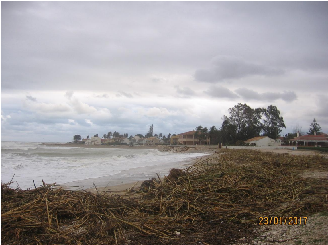
PLAYA LA ALMADRABA. DENIA