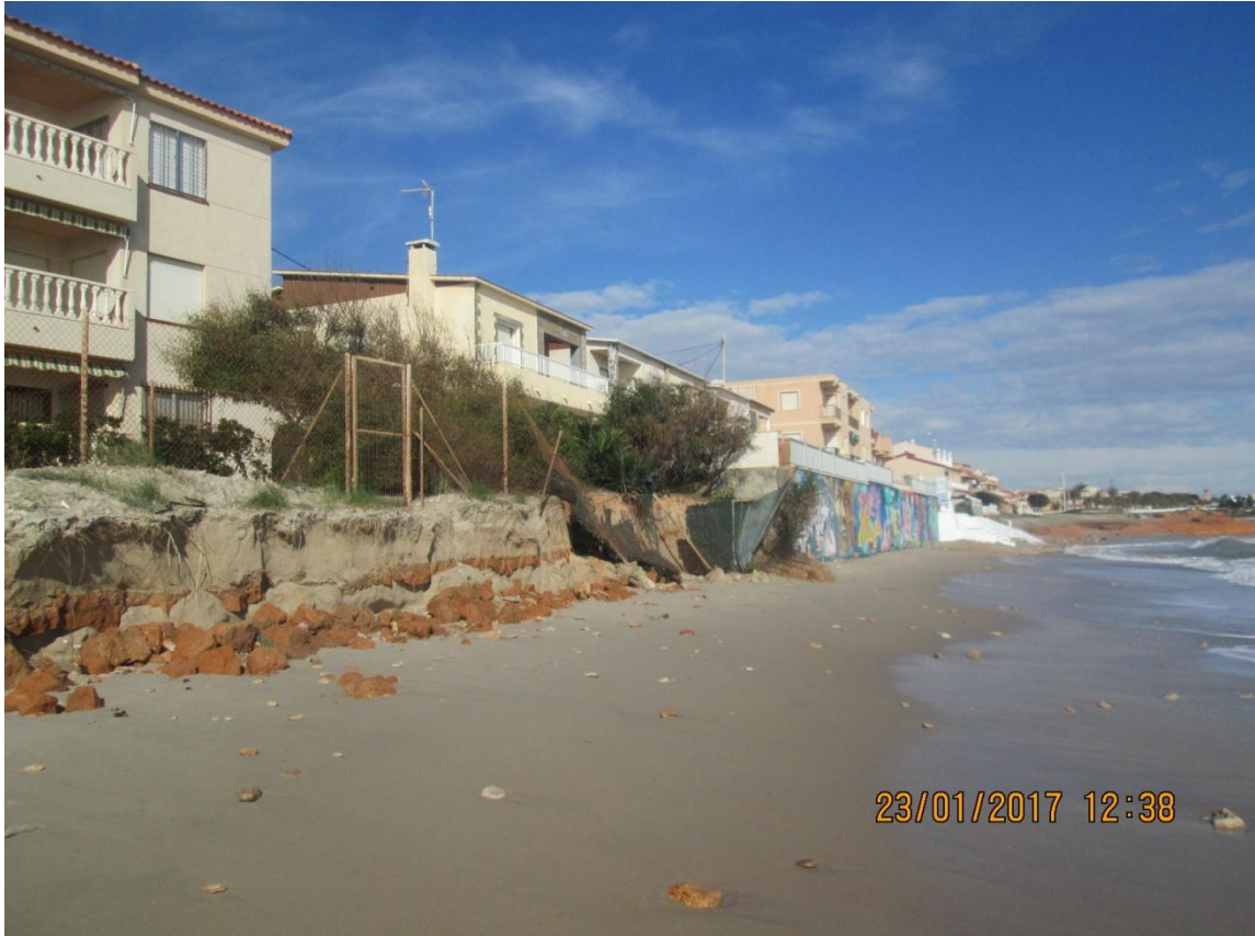
PLAYA LAS VILLAS. PILAR DE LA HORADADA