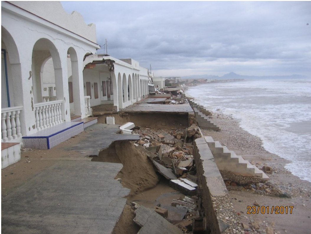
PLAYA DEVESES. DENIA