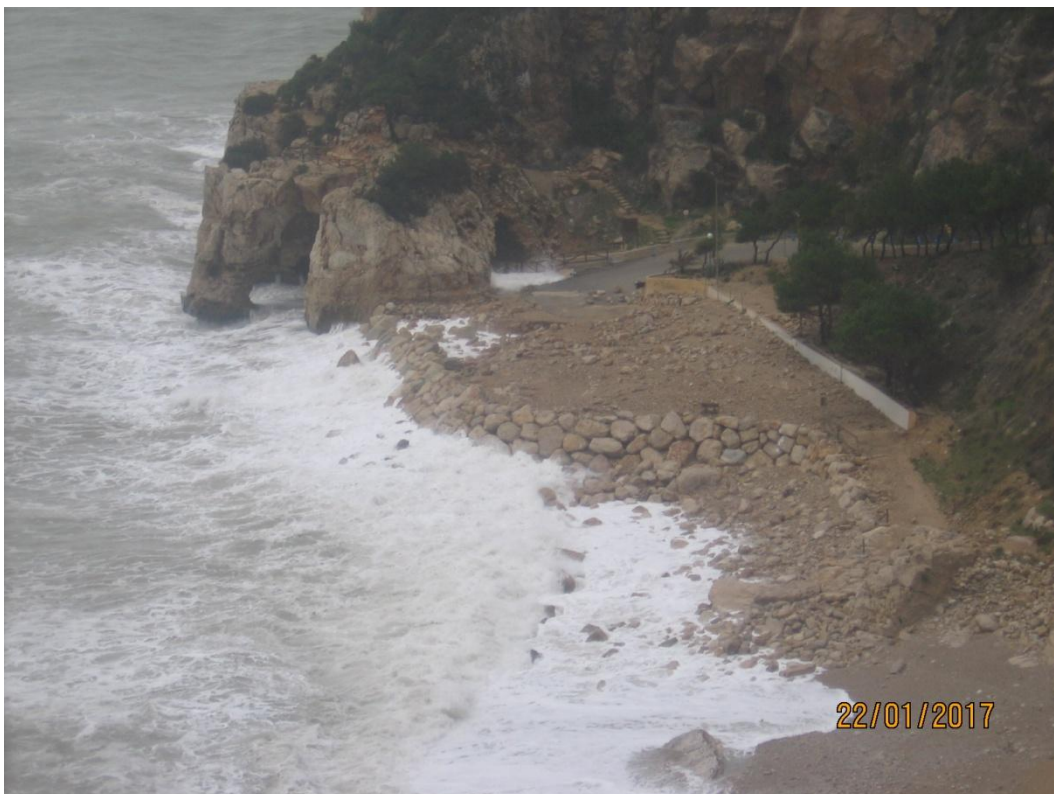
CALA MORAIG. BENITATXELL