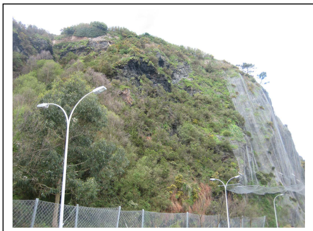
Antes de la actuación