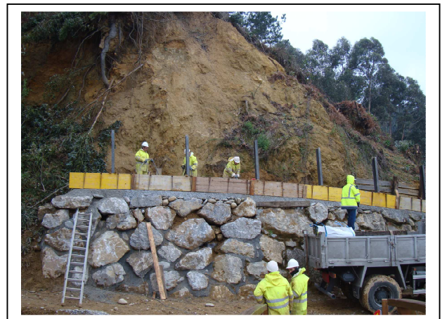
Durante la actuación