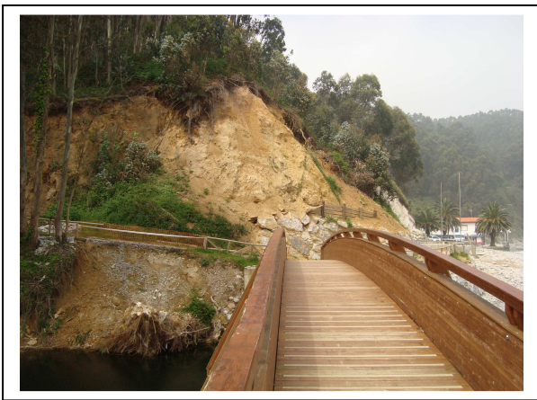
Antes de la actuación