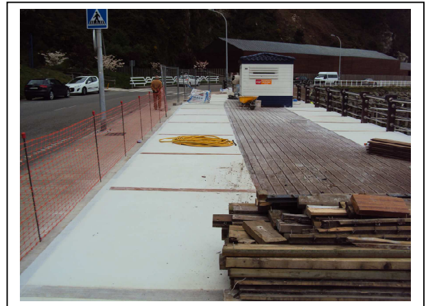
Durante la actuación