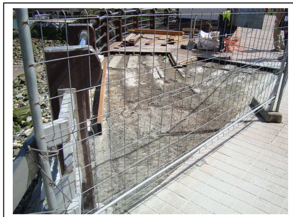
Durante la actuación