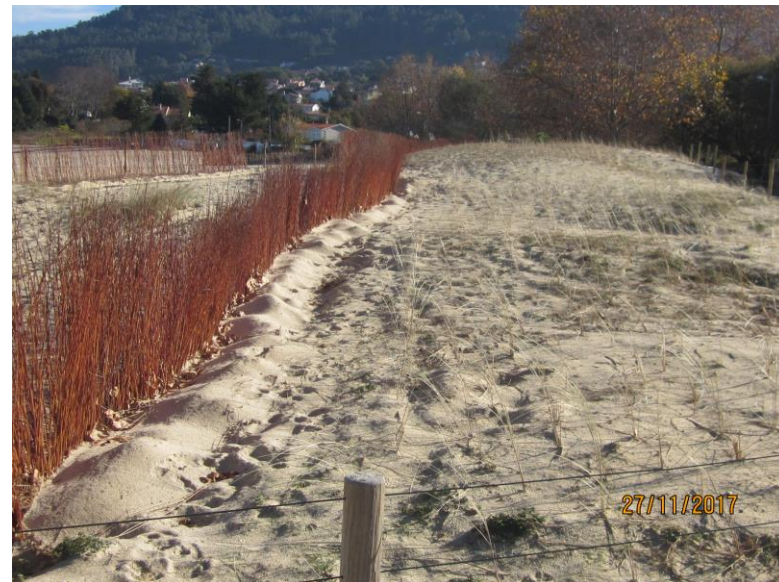
Después de la obra