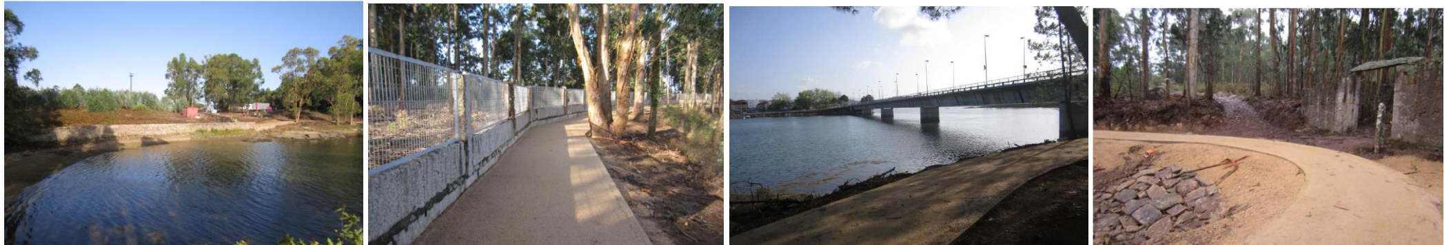
Después de la obra