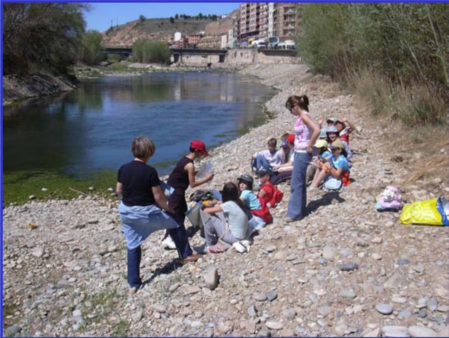
Colegio Público Miguel Servet. Fraga. Río Cinca