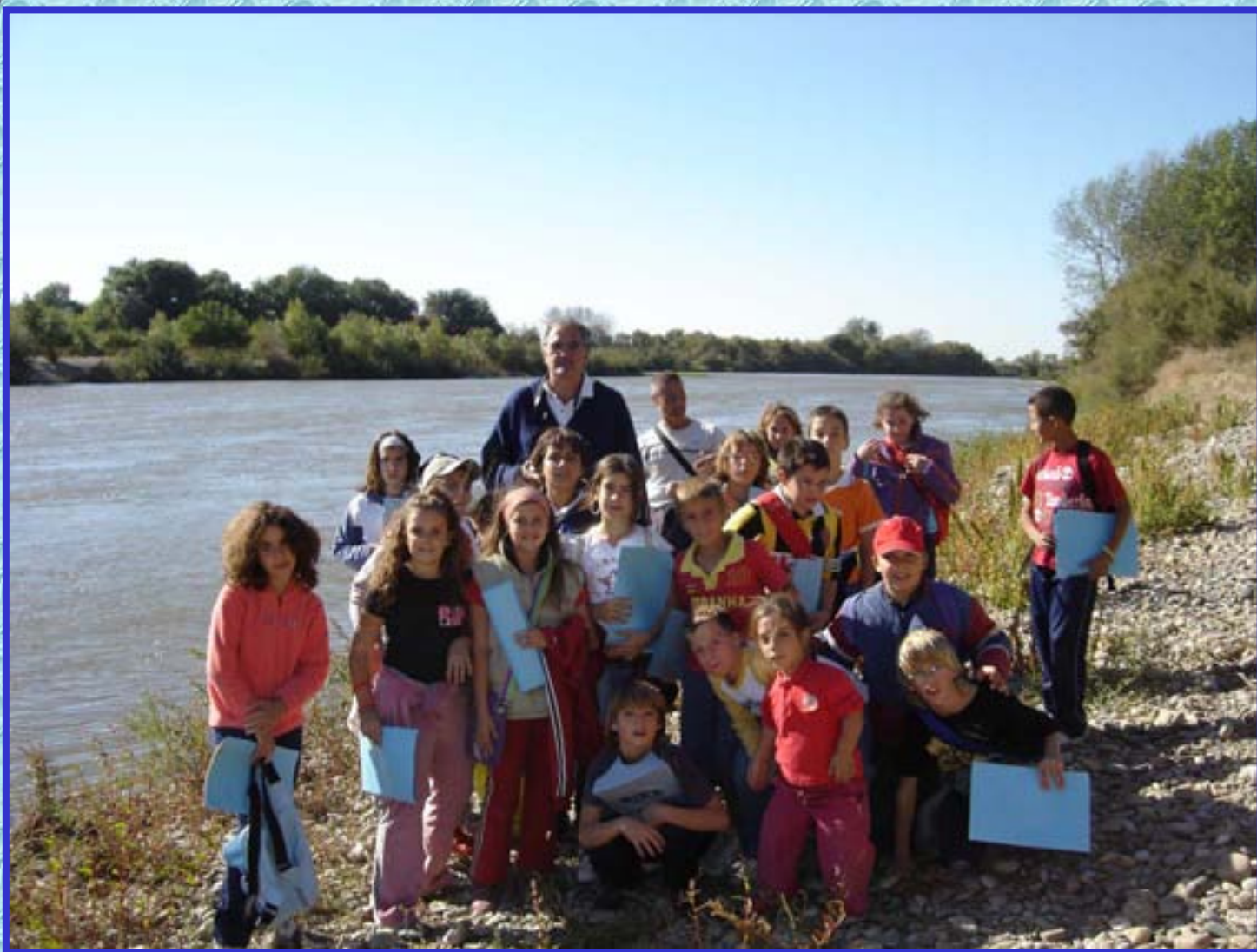
CEIP Ramón y Cajal. Pina de Ebro. Río Ebro