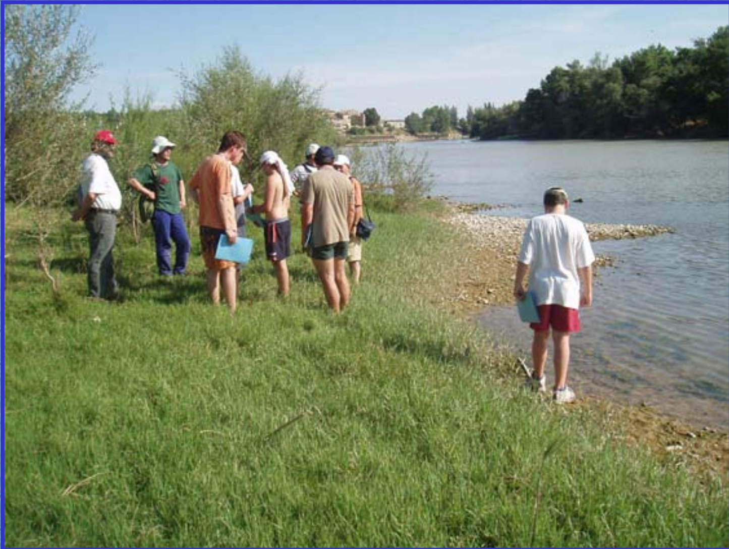
Asociación La Insula. Alcalá de Ebro. Río Ebro