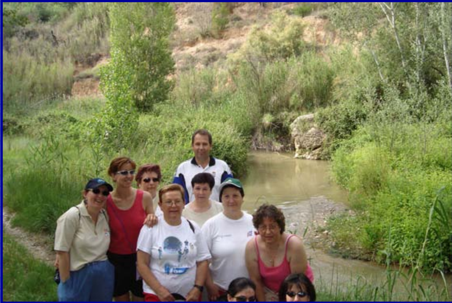
Asociación amas de casa “La Milagrosa” de Híjar. Río Martín