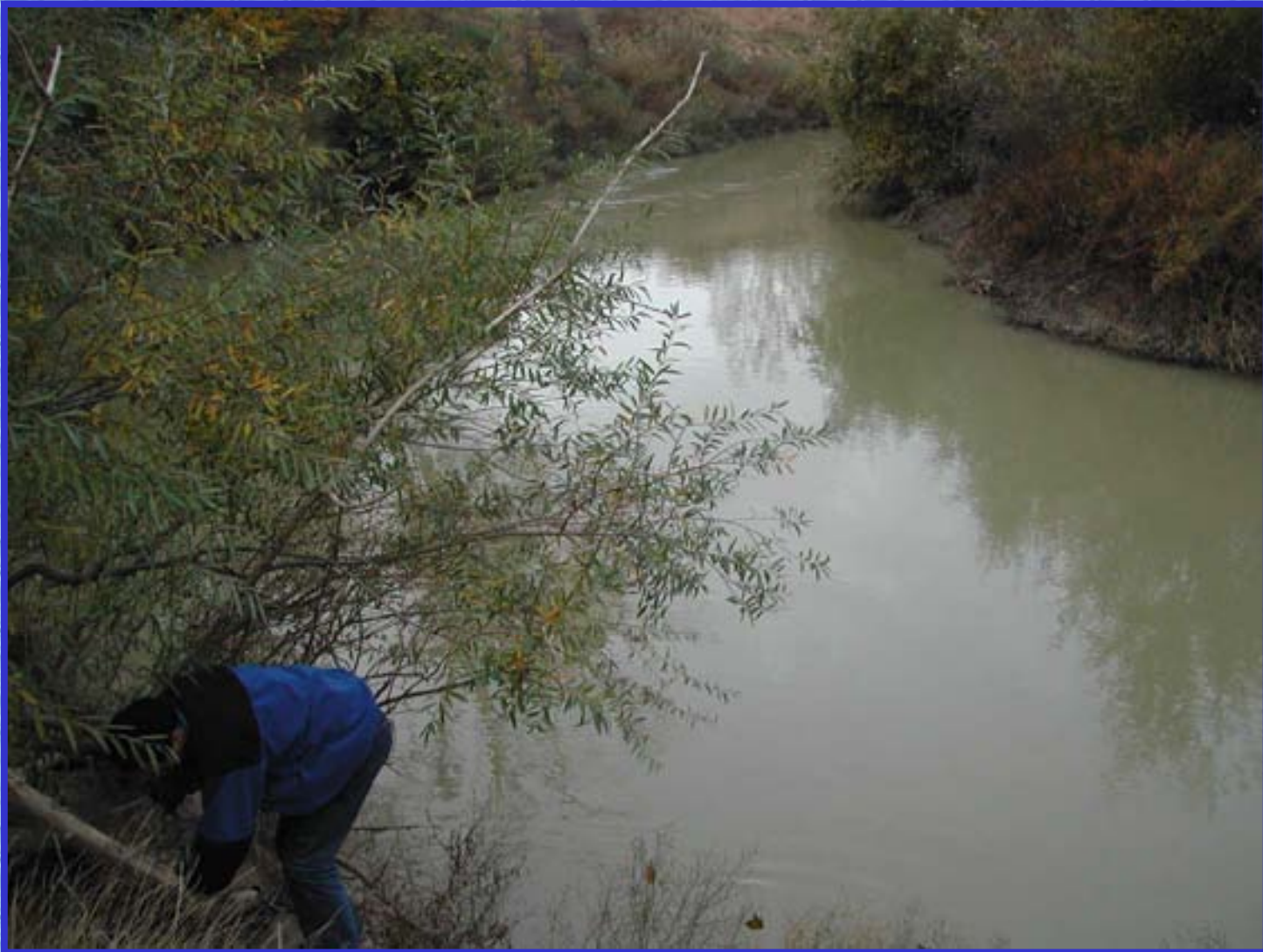
Casa de Cultura. Tauste. Río Arba