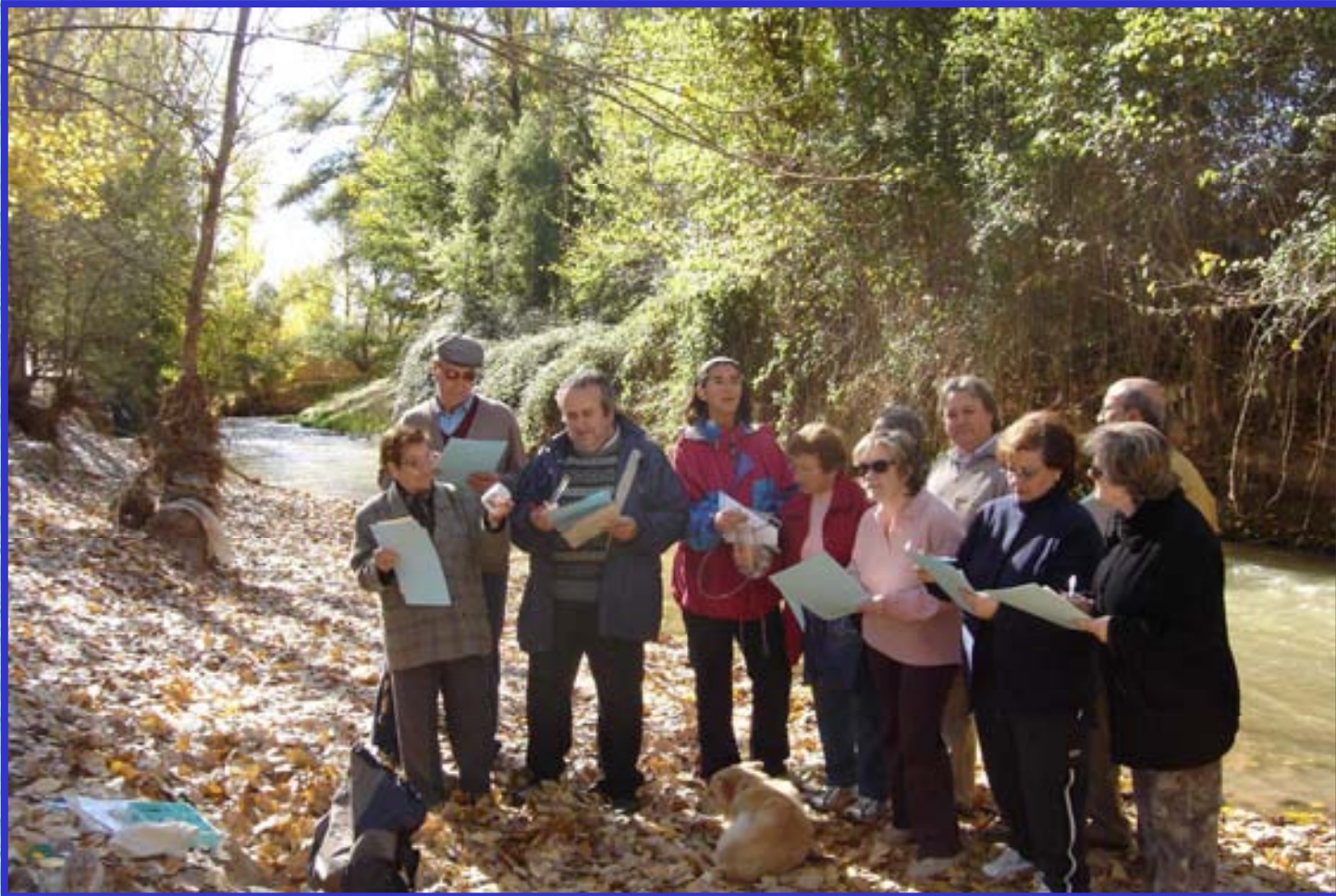
Grupo “Vivir con el río” de Teruel. Río Turia