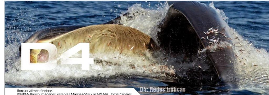
Rorcual alimentándose.