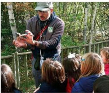
Labor educativa. Durante estos cuatro años la labor de Ambientea ha ido creciendo. Ahora que se aproxima el buen tiempo, las actividades aumentarán, y tanto niños como mayores disfrutarán de los conocimientos sobre el medio ambiente.