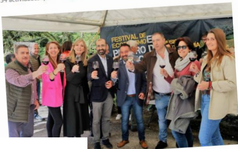
si de ecoturismo. E. C.

La empresa presenta la tercera edición del festival con un programa de 34 actividades que reivindican el estilo de vida de la comarca asturiana