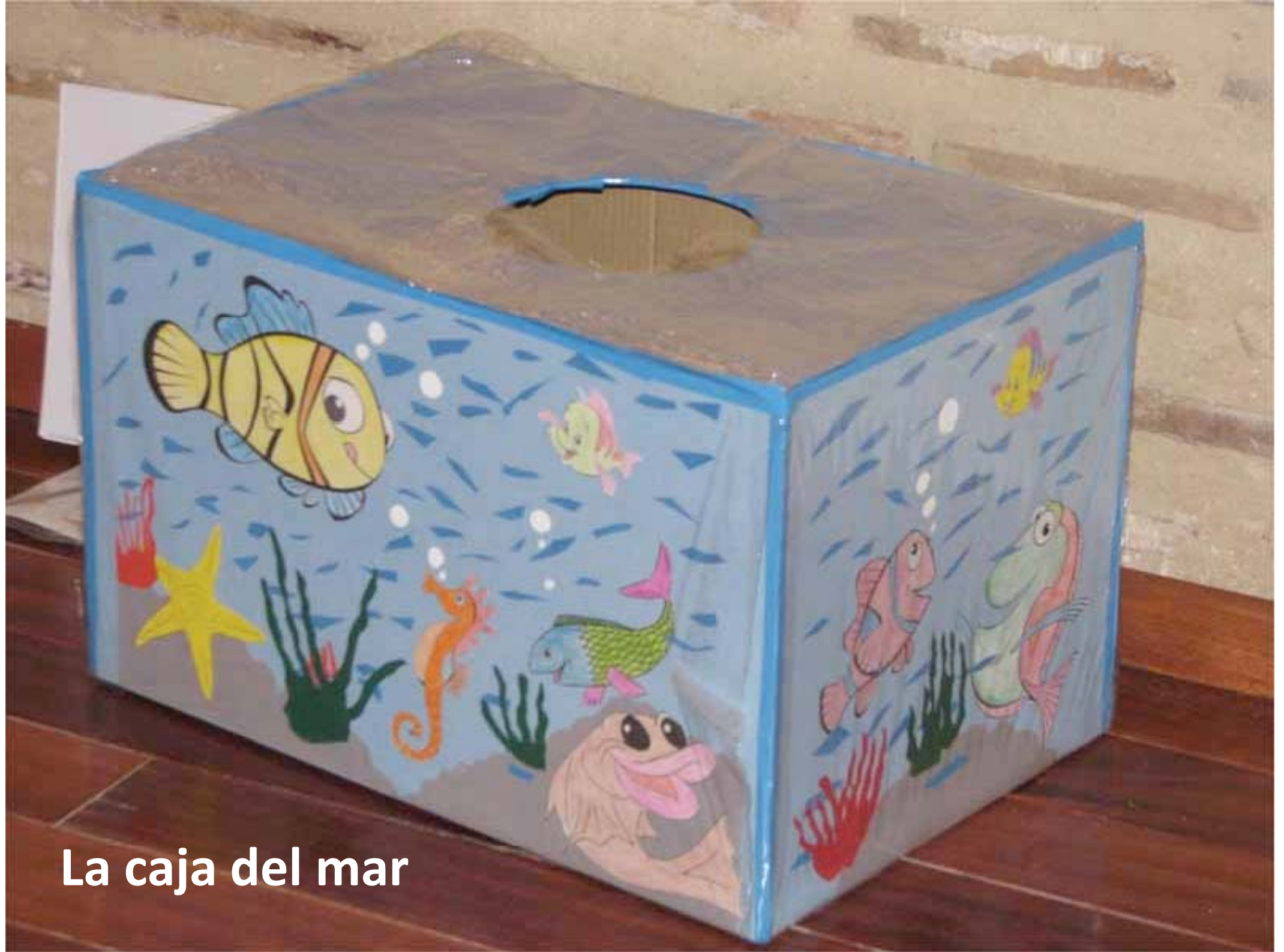
La caja del mar