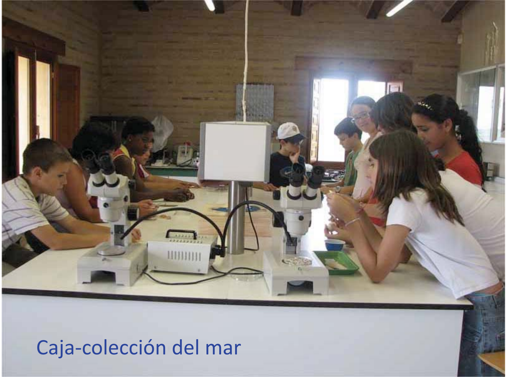
Caja-colección del mar