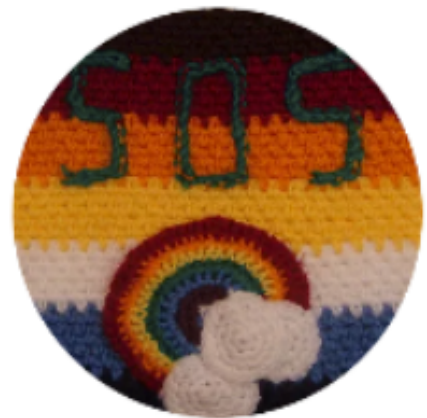
SOS Cambio climático