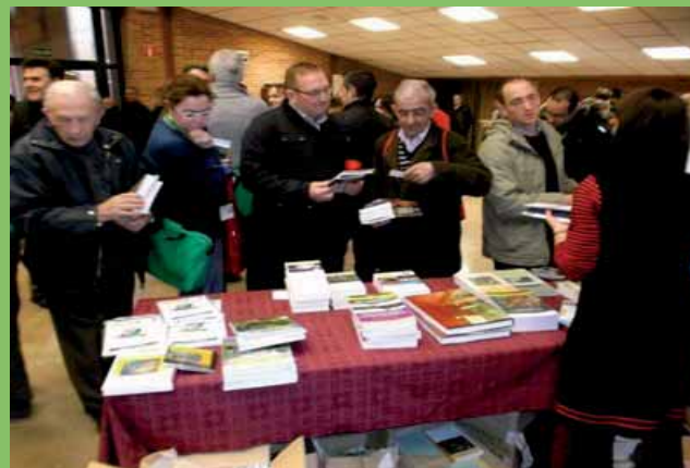
Atención directa/consultas: CDAMA