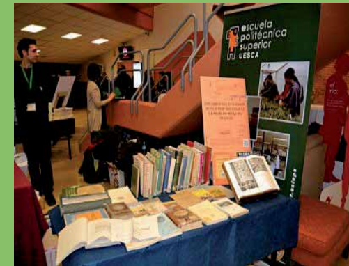
Micro-expo EPS documentación antigua