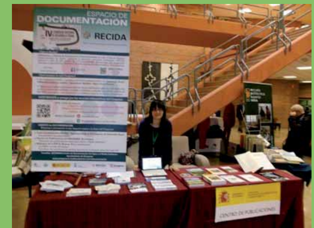
15 cajas publicaciones