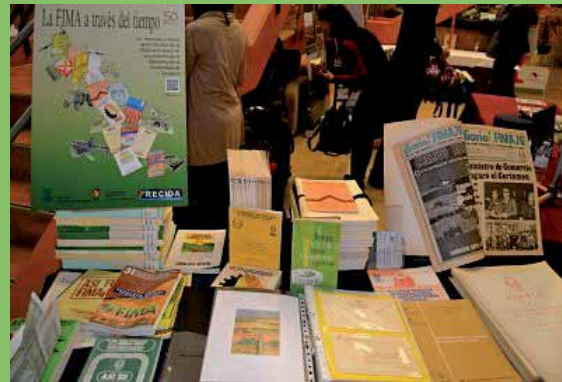
Micro-expo EPS FIMA a través del tiempo