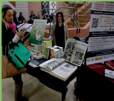
Guía impresa: distribuida en cartera de los congresistas