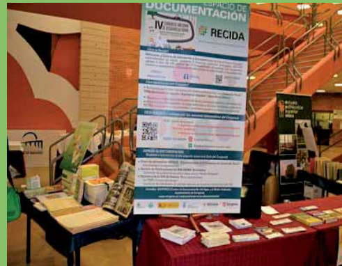
Póster-Publicaciones Ministerio (reclamo) RECIDA -CDAMA