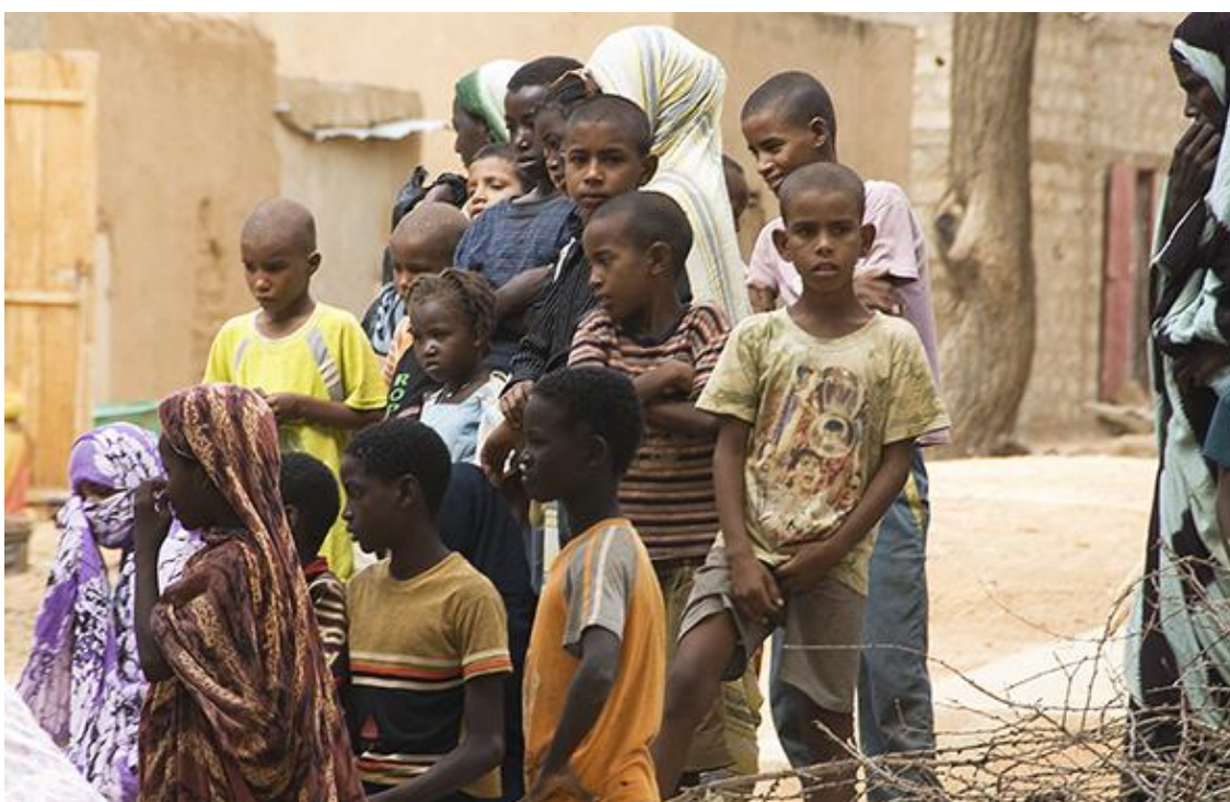
Niños y niñas a la entrada de una escuela en Mauritania.

El informe subraya que para que la educación circule y se reutilice hace falta que cuente con buenos docentes, preparados. Hay países como Mali en donde los profesores poseedores de formación específica apenas pasan del 5 %, en Bolivia no llegan al 60 %, mientras que son casi el 95 % en Costa Rica y Colombia; en Uruguay todos. Como siempre, el África subsahariana se lleva la peor parte: la masiva incorporación de escolares desde hace 30 años no ha ido acompañada de la necesaria preparación de docentes. ¡Qué decir del número de alumnos por docente! (Indicador 4.c.2. de los ODS). En Europa y América del Norte la ratio es de unos 15 alumnos, en América Latina y el Caribe 17, mientras que en el África subsahariana son 44.