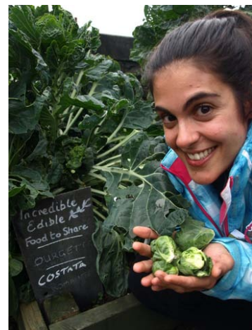
Confirmado: en las calles de Todmorden hay acelgas, ruibarbo y coles de Bruselas a disposición del viandante.

Quizá sea una mezcla de todo eso: un cierto apego por el ocio vinculado a la tierra, un intenso sentido de comunidad, de saberse parte de algo, un afán de trabajar de forma altruista por tus vecinos... el caso es que en estos fundamentos habrá que buscar probablemente el éxito de un programa, Incredible Edible , que tiene en lo comunitario, en la visión de un destino -sostenible- para una comunidad y en la inexcusable visión de forjarlo colectivamente, su más relevante signo de identidad. Porque si la alimentación sostenible, ecológica, de cercanía es el destino, éste solo puede llegar si es buscado entre todos.