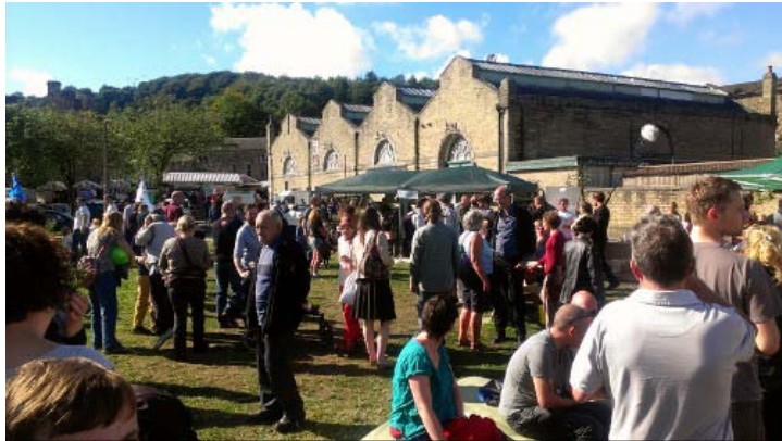
El Festival Anual de la Cosecha es el principal momento festivo en IE-Todmorden. Degustaciones en los puestos de frutas, panes, quesos o verduras y cientos de personas festejando la horticultura, la comida sana y el espíritu de comunidad.

El cariño por el cariño también se observa en el trato que las lideresas de este proyecto tienen hacia los voluntarios, los colaboradores o las personas que se acercan a echarles una mano en cualquiera de sus eventos, en la animación del festival de la cosecha o en la compleja organización del congreso anual de la red internacional Incredible Edible que se celebró en Todmorden el pasado mes de octubre. Emociona ver el cuidado con el que reciben las instrucciones sobre su trabajo, el refuerzo positivo por cada pequeña tarea realizada, el tiempo que les dedican para preguntarles por su familia o enseñarles con mimo el impresionante órgano de la Unitarian Church pese al montón de compromisos que se les agolpan.