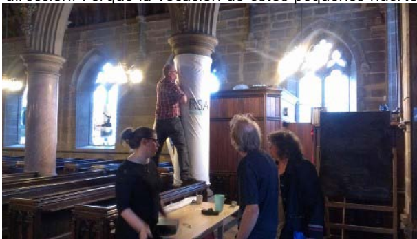
La organización de la Be Incredible Conference es una maquinaria perfecta de voluntariado engrasada por el afecto.

Como compartirá el lector que haya llegado hasta aquí, el paso a la acción desde la reflexión política o desde la denuncia ecológica, es otra de las palancas que hacen de este proyecto algo vitalmente poderoso y socialmente exitoso. No se trata de denunciar los problemas de la sostenibilidad y la soberanía alimentaria desde una manifestación o un artículo de prensa; no se trata de plantar rúculas como mero entretenimiento jardinero: es todo eso y mucho más. Es pasar a la acción desde la reflexión y la crítica; es tomar las riendas de tu propio destino; es mirarse a las manos, mirar las del vecino y sorprenderse de las inmensas capacidades que atesoran ese puñado de dedos movidos en una misma dirección. Porque la vocación de estos pequeños huertos dispersos por la ciudad no es, ni mucho menos,