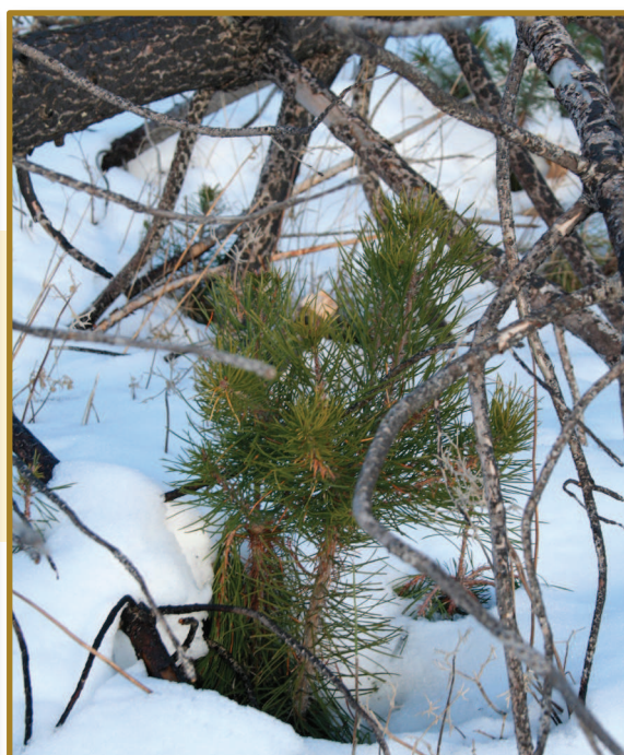
▲ Figura 1. Regeneración post-incendio del arbolado (encina a la izquierda y pino resinero a la derecha) bajo la protección de los troncos y ramas caídas de forma natural en el Parque Nacional de Sierra Nevada (incendio de Lanjarón, Septiembre de 2005). Los estudios desarrollados en parcelas experimentales demostraron que la presencia de la madera quemada redujo el estrés hídrico de las plantas y los daños por herbivoría, a la vez que aportó nutrientes para las plantas.