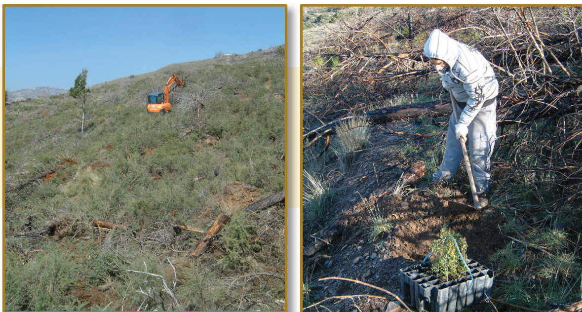
▲ Figura 4. Parcela experimental cuatro años después del incendio de Lanjarón (Parque Nacional de Sierra Nevada, verano de 2005). En esta parcela no se intervino tras el incendio y se dejaron caer los árboles de forma natural. La caída de los árboles quemados en las reforestaciones de coníferas con alta densidad puede producirse en poco tiempo. En este caso, la tasa acumulada de caída de árboles, estimada a partir de 1.800 árboles marcados en una banda altitudinal entre 1400 y 2000 m s.n.m, fue del 0% en 2006 y 2007, 13% en 2008, 83% en 2009 y 98% en 2010. En las parcelas sin intervención pudo hacerse una repoblación mecanizada al cabo de cuatro años. Izquierda: retroexcavadora abriendo hoyos. Derecha: operario plantando encinas en los hoyos abiertos por la retroexcavadora