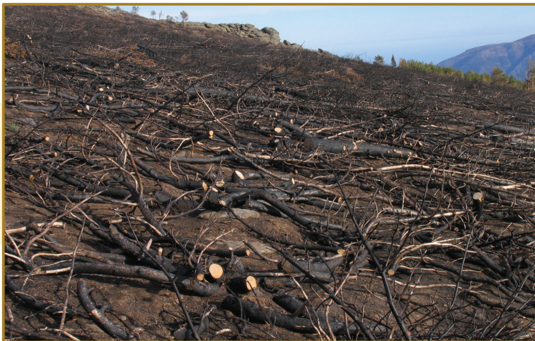
▲ Figura 2. Aspecto de una parcela quemada en la que se apearon los árboles, se desramaron y se cortó el tronco en 2-3 trozas en el Parque Nacional de Sierra Nevada (incendio de Lanjarón, Septiembre de 2005). Las ramas y troncos esparcidos pueden reducir la erosión del suelo.