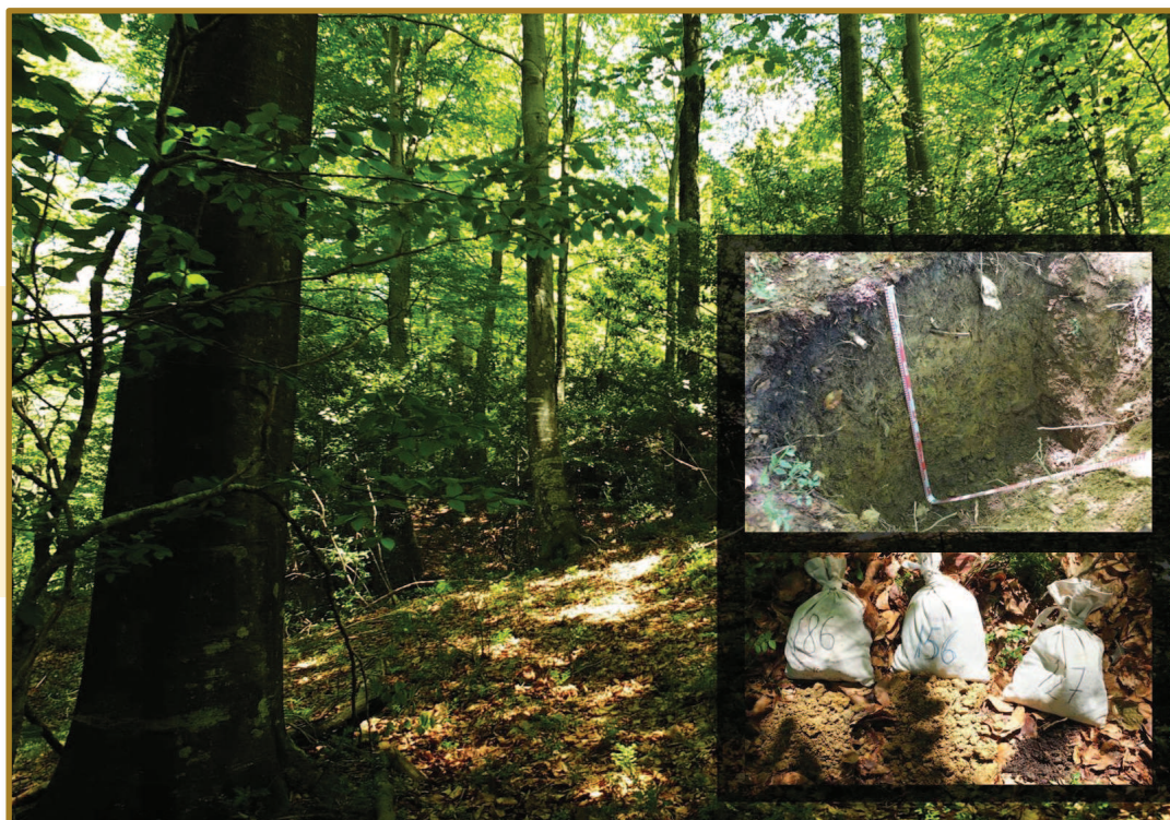
▲ Figura 1. Ejemplo de rodal selecto inventariado (RS71/08/20/001 – Marumendi, Gipuzkoa). Aspecto general de la masa forestal, perfil del suelo y muestras extraídas del mismo.