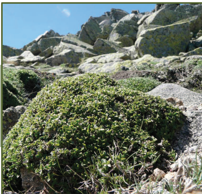
▲ Figura 3. Individuos de Armeria caespitosa (en flor, izquierda) y Silene ciliata (derecha).