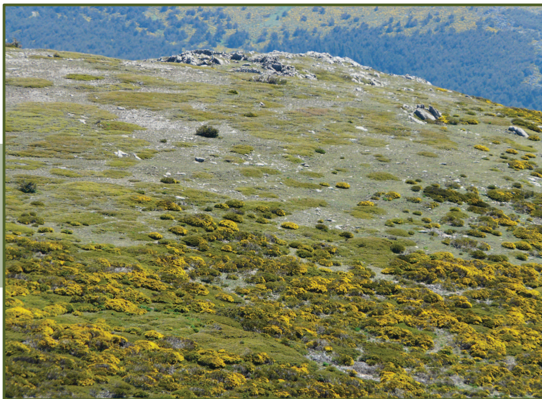
▲ Figura 1. Avance de la comunidad arbustiva (principalmente Cytisus oromediterraneus y Adenocarpus hispanicus ) en los pastos psicroxerófilos del pico del Nevero (2200m), Sierra de Guadarrama.