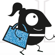
Sesión de meditación