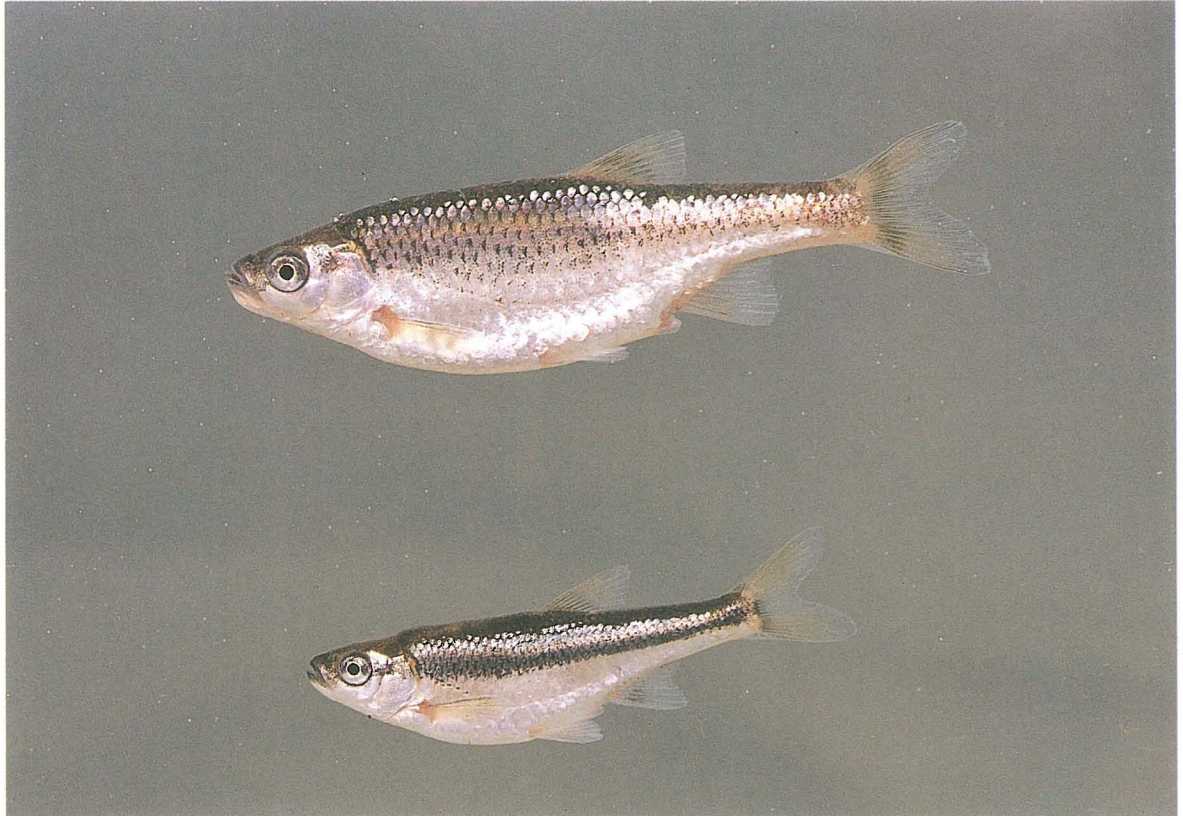
A. DE SOSTOA