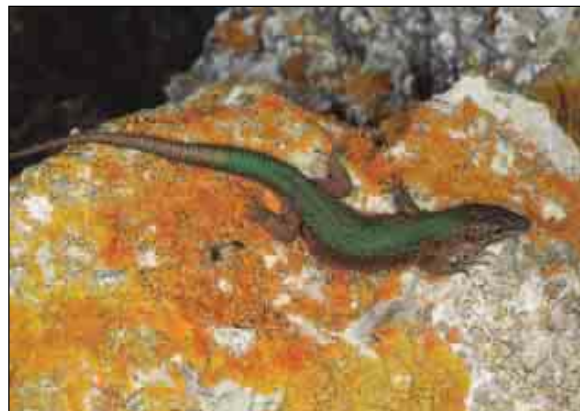
Ejemplar de Adaya Grande.