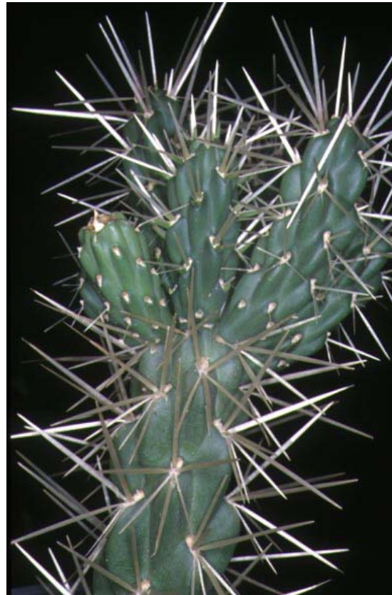
M. Sanz Elorza

Tuna, cholla, cardenche, cardo (cast.); figura de moro, palera chumba (cat.).