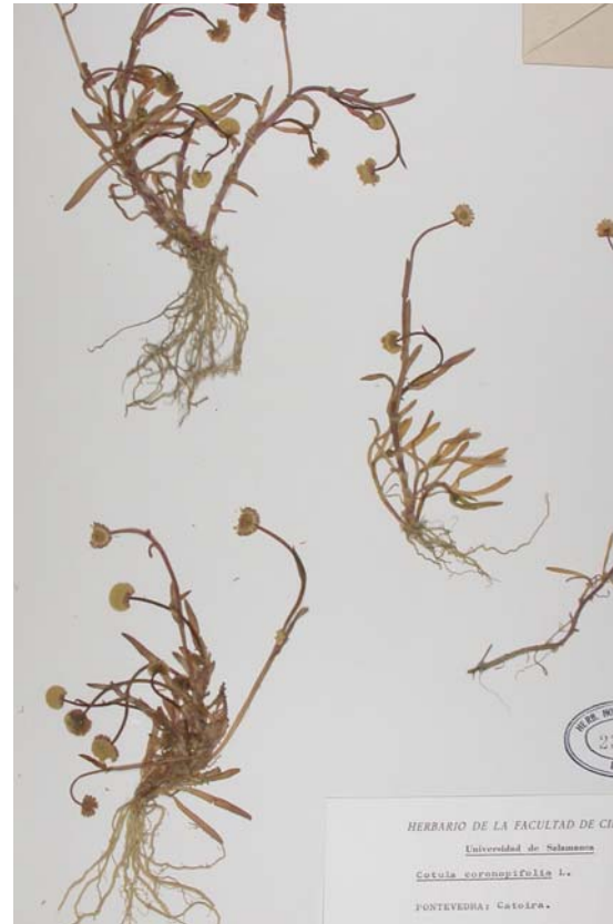
Cotula (cast.); santalina de auga (gal.).