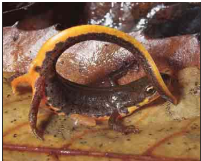
Postura de defensa, ejemplar de Salamanka.

Se encuentra en biotopos muy diversos, como eucaliptales, pinares, bosques de encinas, alcornoques o robles, zonas de matorral y de cultivos, e incluso arenas costeros. Para su reproducción requiere la presencia de cuerpos de agua temporales, como pequeñas charcas, estanques, pozas, abrevaderos, fuentes, arroyos o colas de embalses (DÍAZ-PANIAGUA, 1997; BARBADILLO et al. , 1999, entre otros).