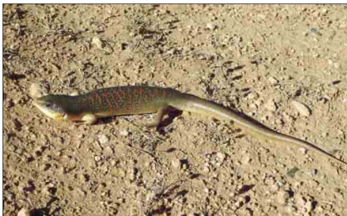
Ejemplar de la Depresión de Saka, Rif Oriental.

Escinco de gran tamaño, con extremidades relativamente cortas. Coloración de fondo parda sobre la que se disponen numerosas bandas transversales anaranjadas y blancas.