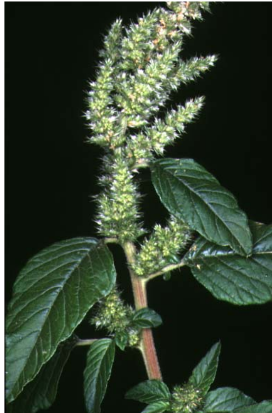
M. Sanz Elorza

Bledo, breo, atacu, atreu (cast.); blet, blet vermell, marxant, marxant gros (cat.); bredro, bleado, meldros (gal.); sabia, sabiya (eusk.).