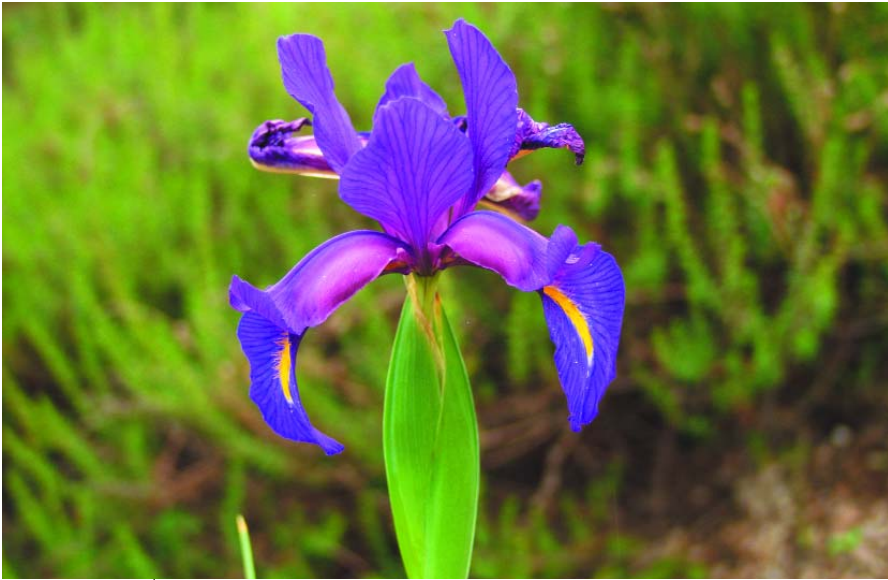
Lirio do Xurés, Lirio de monte