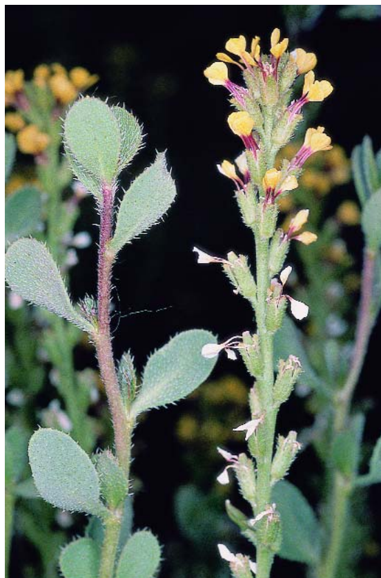
Pítano, falso piorno, buje

Taxón con dos poblaciones muy localizadas y distantes, que están siendo mermadas, principalmente, por repoblaciones forestales y por la extensión de cultivos agrícolas.