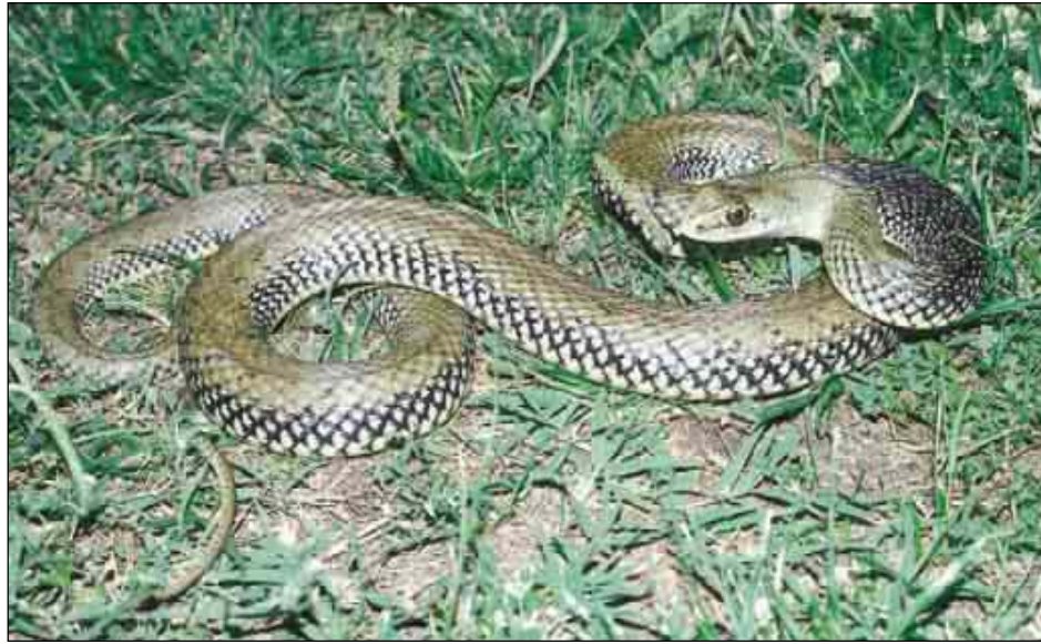
Ejemplar adulto de Santa Coloma de Farners (Girona)

Serp verda (cat.), montpellierko sugea (eusk.), cobregón (gal.)